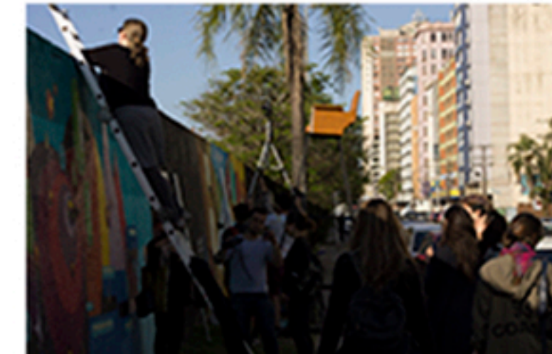
Registro fotográfico da ação coletiva "Espiação", 2016, Thiago Trindade.