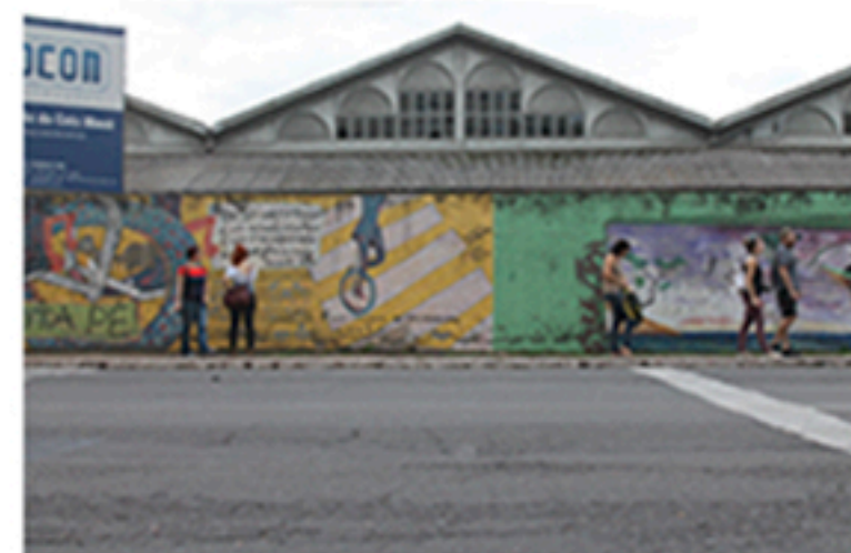
Registro fotográfico da ação "Visita Imprecisa", 2016, Denise Corsino

Realizamos em quatro anos de pesquisa treze ações individuais, cinco ações coletivas, doze publicações, produção de materiais gráficos, exposições coletivas e individuais e uma plataforma virtual, todos vinculados ao objeto Muro da Av. Mauá.