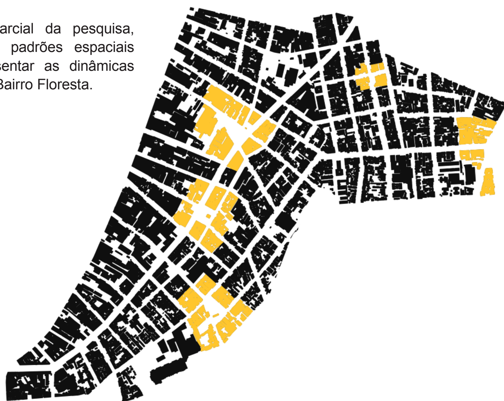
FIG.1: Bairro Floresta, Porto Alegre. Em destaque, regiões identificadas como o padrão espaços públicos abertos

Como resultado parcial da pesquisa, foram identificados padrões espaciais capazes de representar as dinâmicas sociais internas do Bairro Floresta.