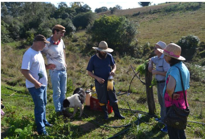
Figura 3: Visita de Certificação em Unidade de Produção Agrícola do Núcleo

Vale do Rio Pardo ocorre a cada dois meses, os grupos indicam um representante e um suplente, estes agricultores além de representarem os grupos no Núcleo formam as Comissões de Verificação de Conformidade Orgânica, que realizam as visitas de certificação.