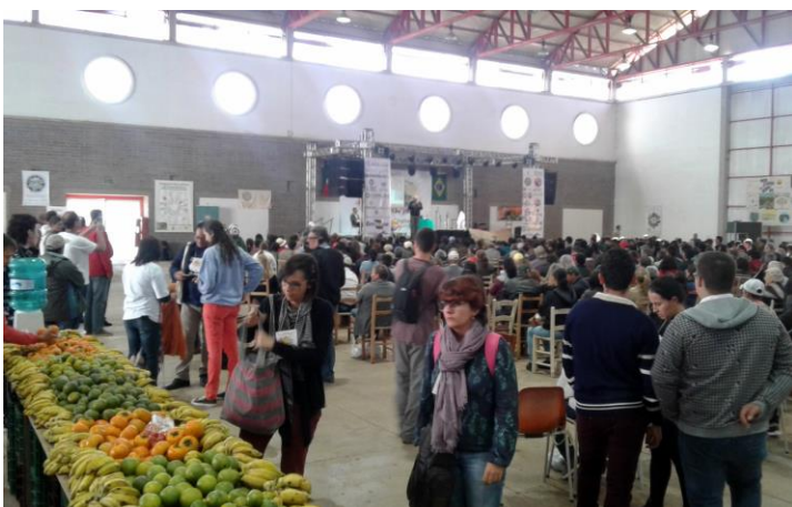
Figura 4: Encontro Ampliado da Rede Ecovida 2017.

Cada uma dessas esferas possui fóruns específicos para deliberação e tomadas de decisões, sendo eles: Reuniões dos grupos, plenárias de Núcleos, plenárias estaduais, plenária geral e Encontro Ampliado (espaço maior de encontro dos membros da Rede e que se realiza a cada 2 anos). (REDE ECOVIDA Disponível em: http://www.ecovida.org.br )