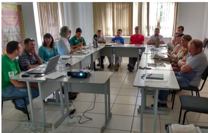
Figura 6: Plenária Núcleo Regional Vale do Rio Pardo em 12 de abril de 2017