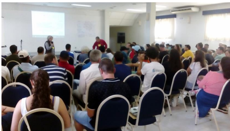
Figura 1: Plenária Rede Ecovida 2017

Em levantamento realizado na última Plenária da Rede Ecovida de Agroecologia (Outubro 2017), consta com 27 Núcleos regionais e três pré-Núcleo 3 , cerca de 352 municípios, em torno de 407 grupos de agricultores envolvendo cerca de 4.500 famílias e 20 ONG's nos estado do Sul do Brasil.