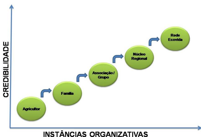
Figura 2: Organização e credibilidade na Rede Ecovida

O funcionamento da Rede é horizontal e descentralizado e está baseado na organização das famílias produtoras em grupos informais, associações ou cooperativas. Estas organizações se articulam com associações ou cooperativas de consumidores, ONGs e outras instituições e formam um Núcleo Regional, circunscrito a determinada área geográfica. Cada Núcleo tem uma coordenação com a tarefa de animação e gestão. A soma dos diferentes Núcleos (nos estados do RS, SC e PR) formam a Rede Ecovida de Agroecologia. Da mesma forma que o Núcleo, há na Rede uma coordenação composta por representantes dos estados que além da função animadora, também possui uma função organizativa.