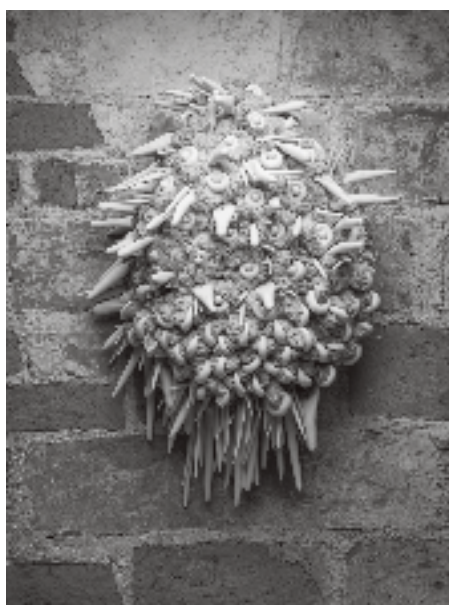
Figura 3 · Márcia Braga, “Este Corpo já foi meu”, 2015. Objeto (tecido, linha e cerâmica).