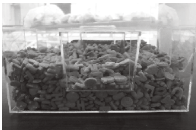
Figura 1 - Márcia Braga, "Comer o Livro", 2014. Instalação (mobiliário, redoma de acrílico e bolachas em formato de letras).