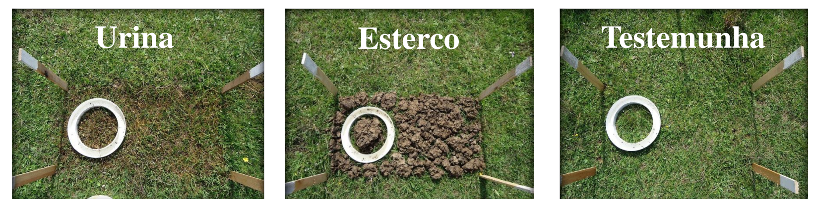
Figura 1. Tratamentos