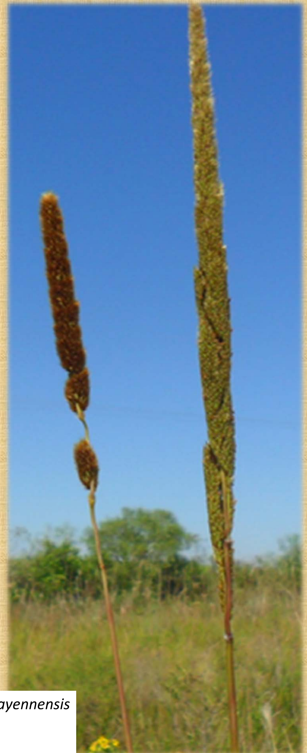
Figura 1. Inflorescências de E. cayennensis (esquerda) e E. villosa (direita).

* Número de células analisadas (número de indivíduos). † Porcentagem de células normais.