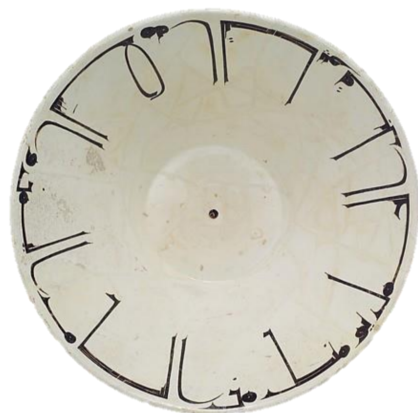
Fig. 3. Vasilha com inscrições, séc. XI E.C. | Argila com policromo esmaltado, 35 x 18,8 cm | The Metropolitan Museum