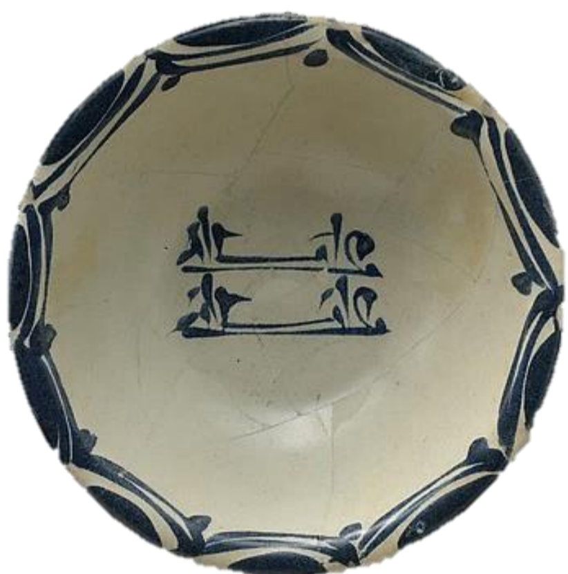
Fig. 2. Vasilha emulando cerâmica chinesa, séc. IX E.C. | Argila com esmalte branco e azul, 6 x 20,3 cm | The Metropolitan Museum