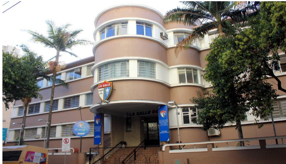
LA SALLE, [201-?]

Segundo o Guia da Escola Lassalista (GUIA..., 2010) mais do que ensino propriamente dito, a Rede La Salle está preocupada com a formação dos indivíduos, procurando orientar seus alunos e os outros integrantes da comunidade, para que ajam, e de fato sejam, pessoas com valores de acordo com os ensinamentos de Jesus Cristo. Não apenas voltado para o ensino intelectual, a Educação Lassalista se preocupa em assegurar a formação integral, o exercício da cidadania, buscando uma progressão no trabalho e nos estudos posteriores.