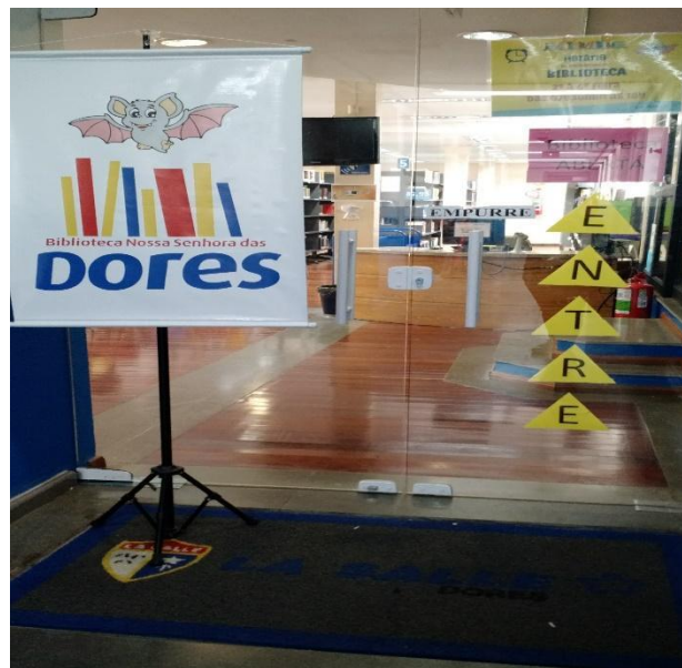
Figura 2 – Entrada da Biblioteca