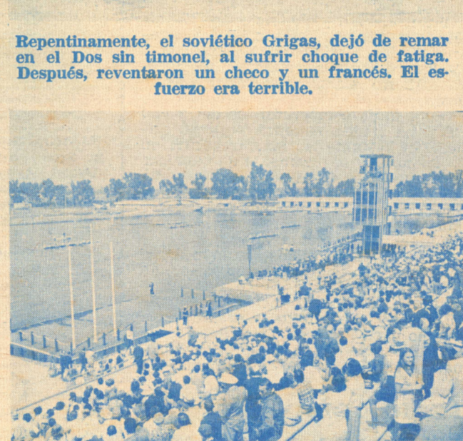
Una hermosa panorámica al finalizar el primer heat eliminatorio de Ocho Largos, ganado por Checoslovaquia, pese al esfuerzo estadounidense.