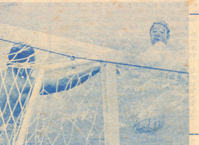
Los resultados de los juegos de hoy, fueron catastróficos. Puras goleadas.