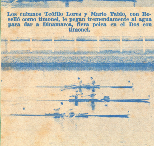
Alemania (5), Suiza (4) y Polonia (6), en plena lucha por el triunfo en el segundo repechaje de Dos sin timonel. Ganó Suiza, en tremenda carrera.