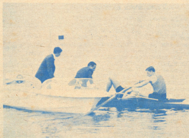
Repentinamente, el soviético Grigas, dejó de remar en el Dos sin timonel, al sufrir choque de fatiga. Después, reventaron un checo y un francés. El esfuerzo era terrible.