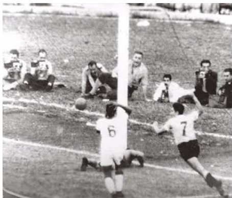
Foto 13 - O gol visto das arquibancadas.