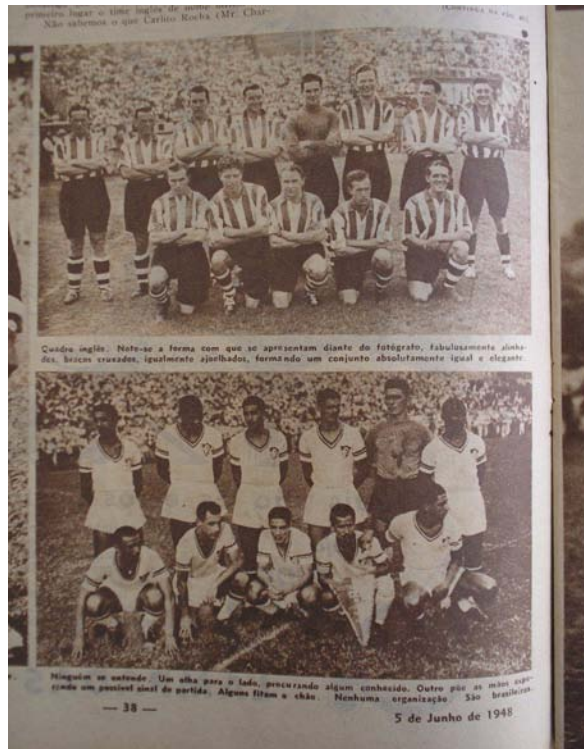
Foto 5 - Civilização X Atraso: vitória do Fluminense sobre o Southampton não foi suficiente para apagar estereótipos.