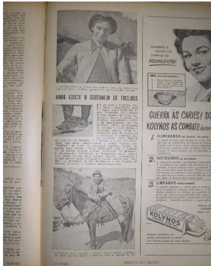
Foto 3 - O sertão esquecido: em 1950, Revista do Globo compara vaqueiro aos antigos habitantes de Canudos.