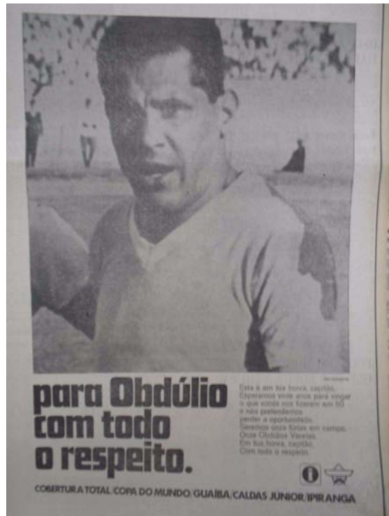
Foto 16 - A vingança necessária: o Correio do Povo divulga a semifinal de 1970.