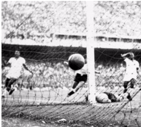
Foto 12 - A foto clássica do gol de Ghiggia.