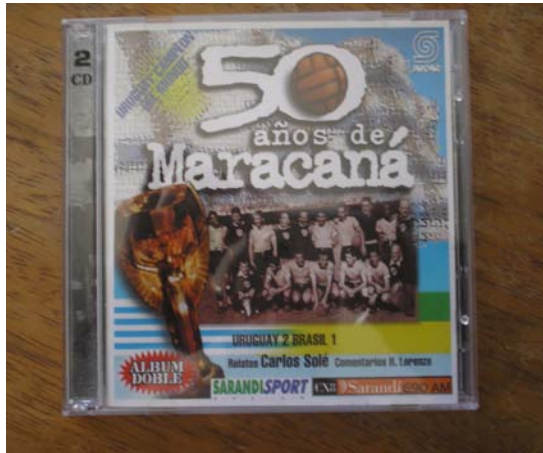
Foto 7 - A memória dos vencedores: cd uruguaio com a gravação completa do Maracanazo.