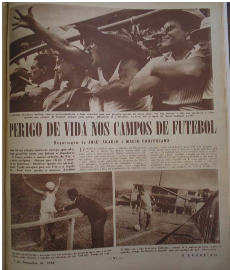
Foto 8 - O Cruzeiro na campanha pela construção do Maracanã.