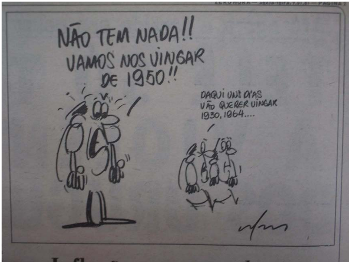
Foto 18 - A vingança em novo contexto: charge de Zero Hora antes da final do Torneio Mundialito.