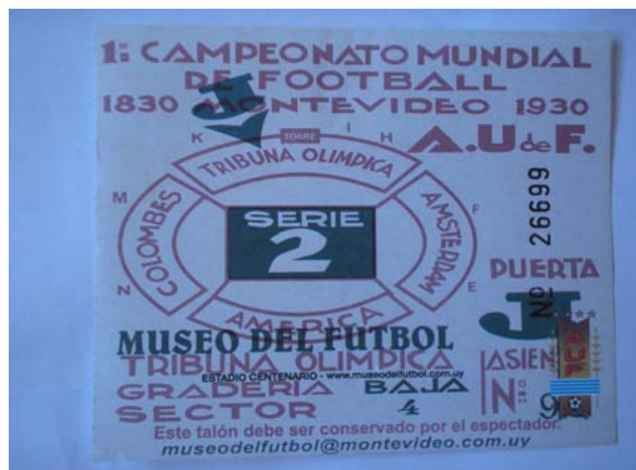
Foto 6 - A memória dos vencedores: ingresso do Museo del Fútbol, em Montevideo.