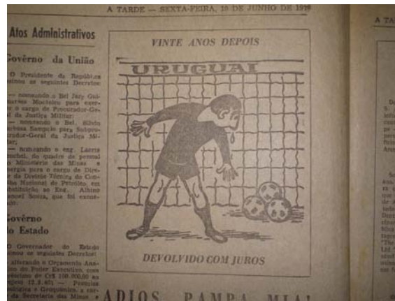
Foto 17 - A vingança comemorada: charge de "A Tarde" sobre a semifinal de 1970.