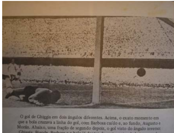
Foto 14 - O gol pelo ângulo inverso.