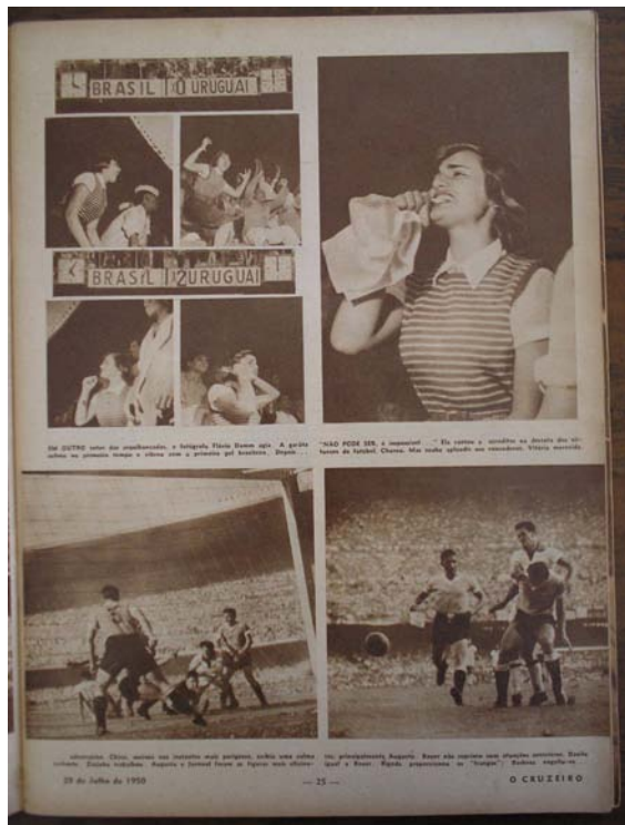
Foto 10 - No alto da página, torcedora assiste partida decisiva entre Brasil X Uruguai.