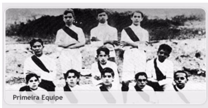
Foto 4 - Primeira equipe do América Mineiro.