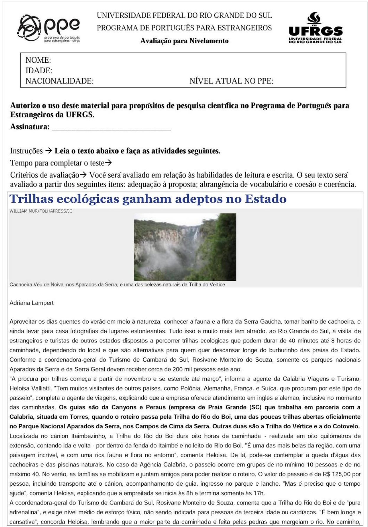
Figura 6: Teste de Nivelamento proposto neste trabalho – Parte A