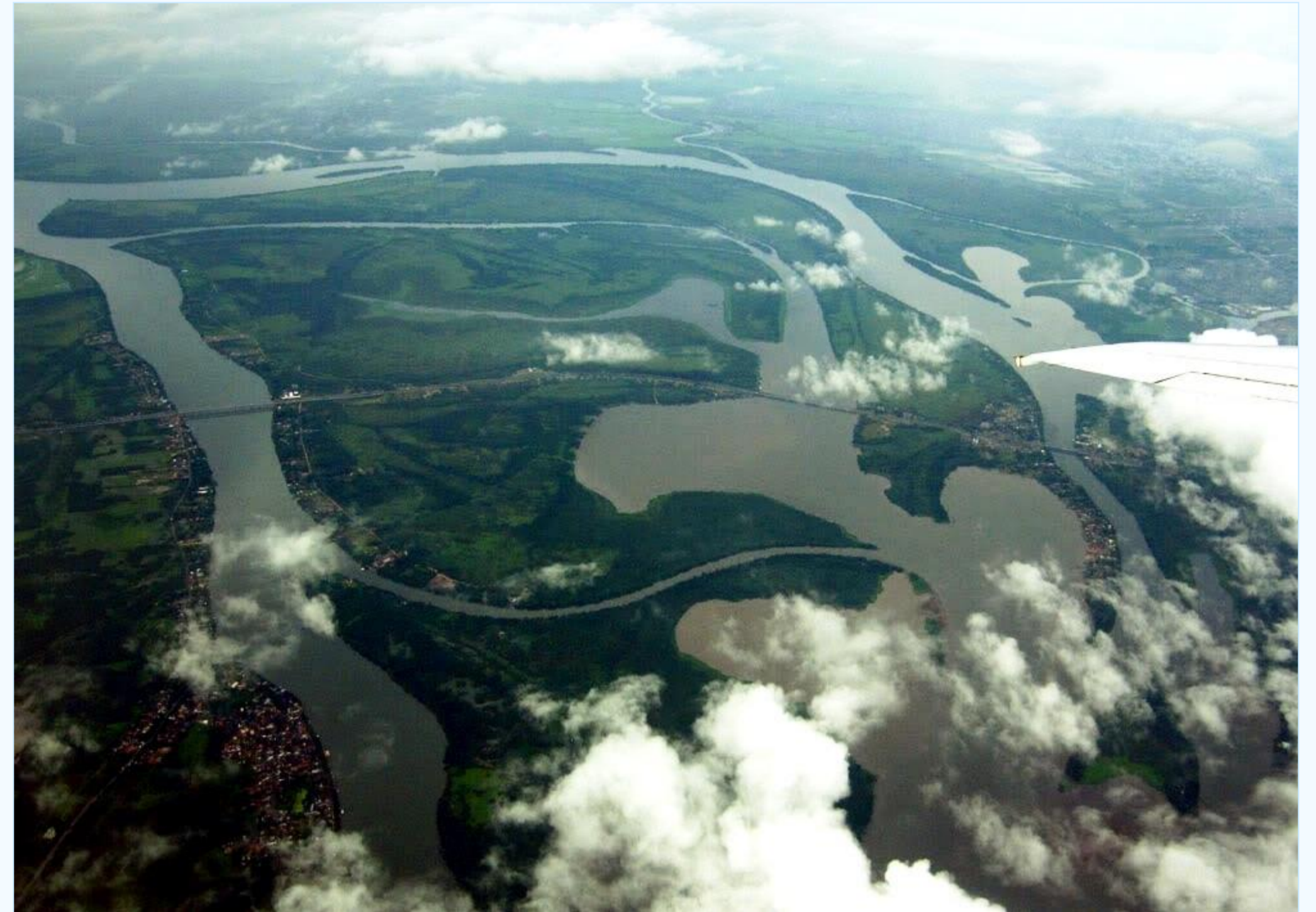
Figura 1 – Imagem vôo de pássaro do Delta do Jacuí.

Como resultado, espera-se que o modelo integrador da evolução deltaica ajude o manejo ambiental da região, contribuindo para a preservação de toda área e melhor conhecimento da mesma.