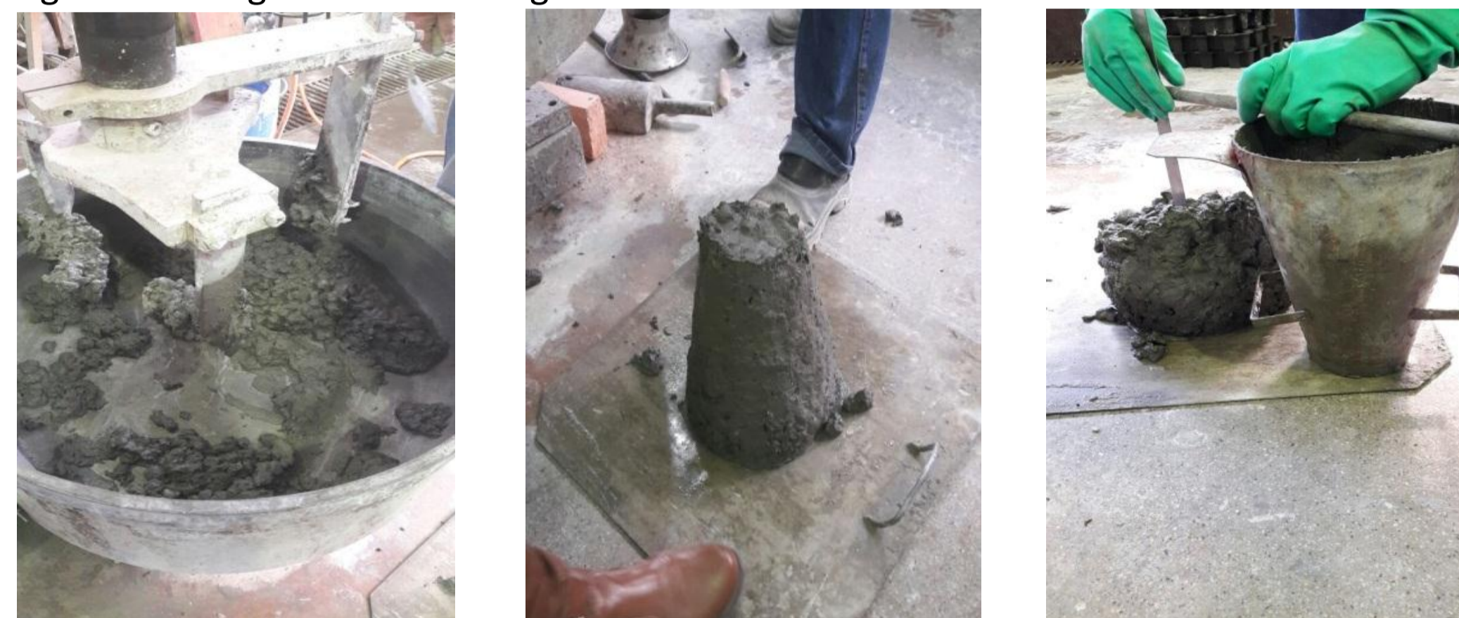
Figura 2 - imagens da concretagem.

Os dados da concretagem como o traço em massa, o percentual de aditivo e o slump podem ser vistos na tabela 1. O ensaio de resistência à compressão foi realizado em conformidade com a NBR 5739 (ABNT, 2007). O ensaio de absorção de água por capilaridade foi realizado em conformidade com a NBR 9779 (ABNT, 2012). Já para o ensaio de molhamento foram moldados concretos nas dimensões de 10x10x5cm, sendo que a medição do ângulo de contato foi realizado através da utilização de software AutoCad, após o gotejamento de uma gota d'água na superfície do concreto.