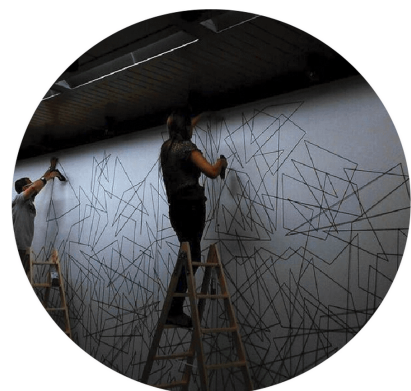
Participantes da "Zona Baixa" na exposição "In the beginning was..." da artista Chiharu Shiota.