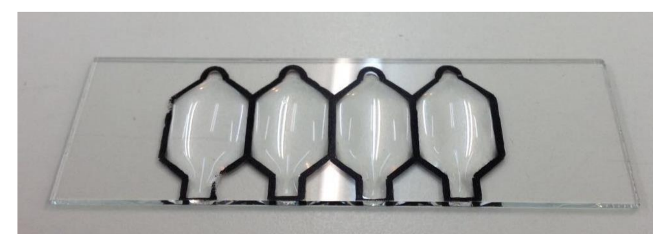
Impressão por termorresistência em lâmina

Para se obter o formato e altura desejados da câmara de contagem é necessário que se encontre o método de aplicação ideal: que permita que o adesivo ou resina fique na altura de 20µm. Esta altura garante a formação de uma única camada de células espermáticas. Várias ideias já foram formuladas para a aplicação desses materiais, a que mais se aproximou de um resultado satisfatório foi impressão por termorresistência.