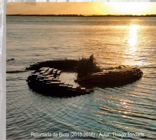
Retomada da Biota (2015-2016)