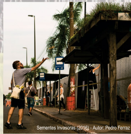
Sementes Invasoras (2016) - Autor: Pedro Ferraz

A partir desta ação e reflexões feitas ao longo do ano que alimentaram minha pesquisa individual, Retomada da Biota – ocupações orgânicas e transitoriedades , destaco como ações e intervenções urbanas individuais, Senso Demográfico (2015–2016) , Retomada da Biota (2015–2016) e SEMENTES INVASORAS (2016) , que ocorreu durante a iniciativa ARTE NO MURO (2016) , no Muro da Avenida Mauá em Porto Alegre.