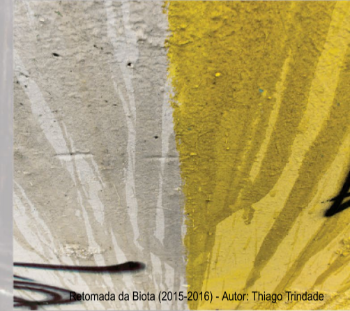
Retomada da Biota (2015-2016)