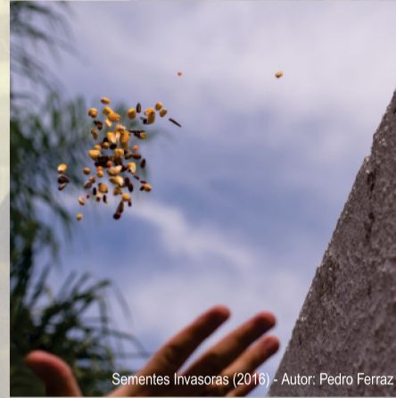
Sementes Invasoras (2016) - Autor: Pedro Ferraz