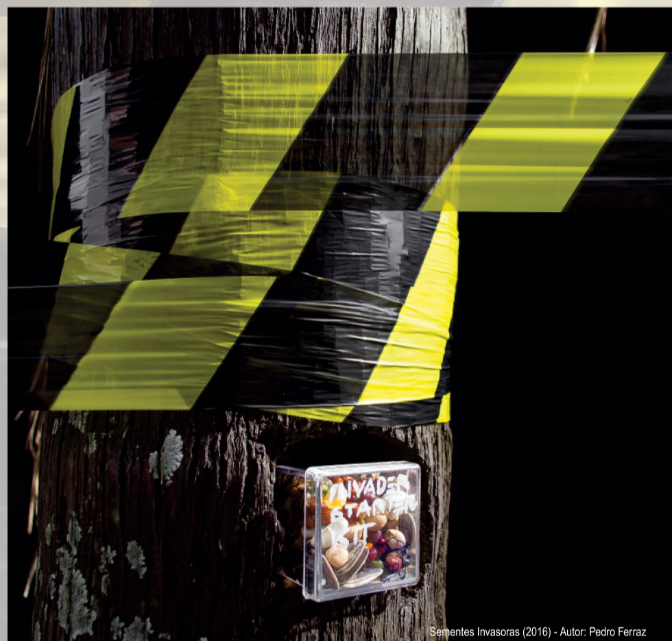
Sementes Invasoras (2016) - Autor: Pedro Ferraz