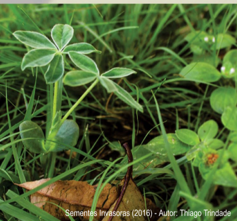
Sementes Invasoras (2016) - Autor: Thiago Trindade