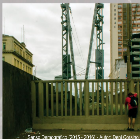
Senso Demográfico (2015 - 2016)