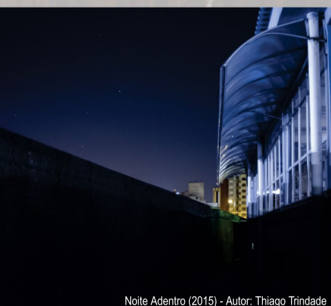
Noite Adentro (2015) - Autor: Thiago Trindade