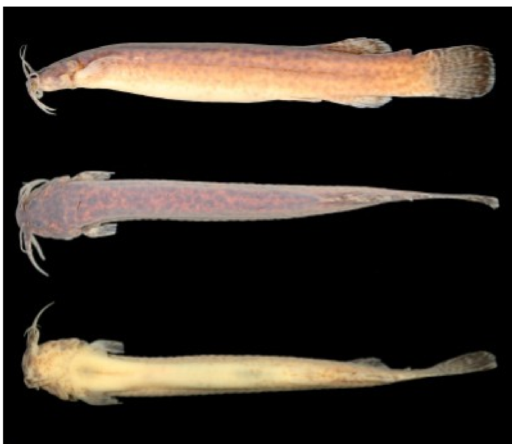
Fig. 2: I. sp. n. ibicuí . UFRGS 21829, 62.0 mm CP.

A nova espécie (Figs. 2,3), apresenta as três sinapomorfias propostas por Costa & Bockmann (1993) e diferencia-se de seus congêneres através de medições, caracteres osteológicos e pelo padrão de coloração.