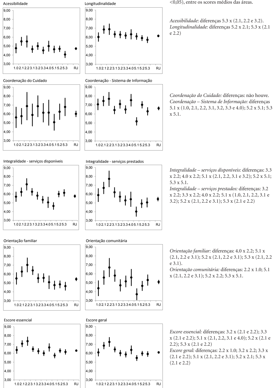
Figura 2. Escore médio e intervalos de confiança (IC 95%) dos atributos da Atenção Primária à Saúde na experiência dos usuários crianças por Área de Planejamento - Município do Rio de Janeiro – 1º semestre de 2014.