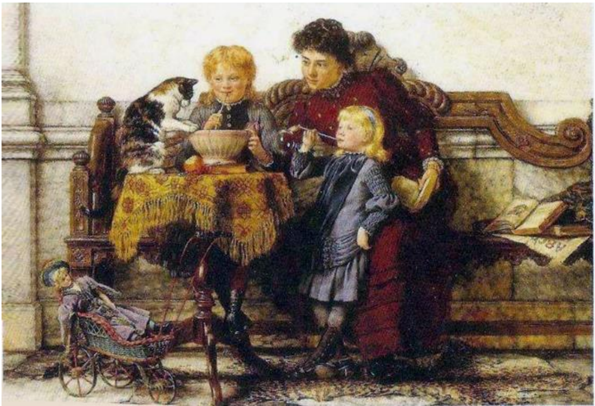
Imagem 29 - Weingartner. Fazendo Bolhas de sabão s/d. Coleção particular.