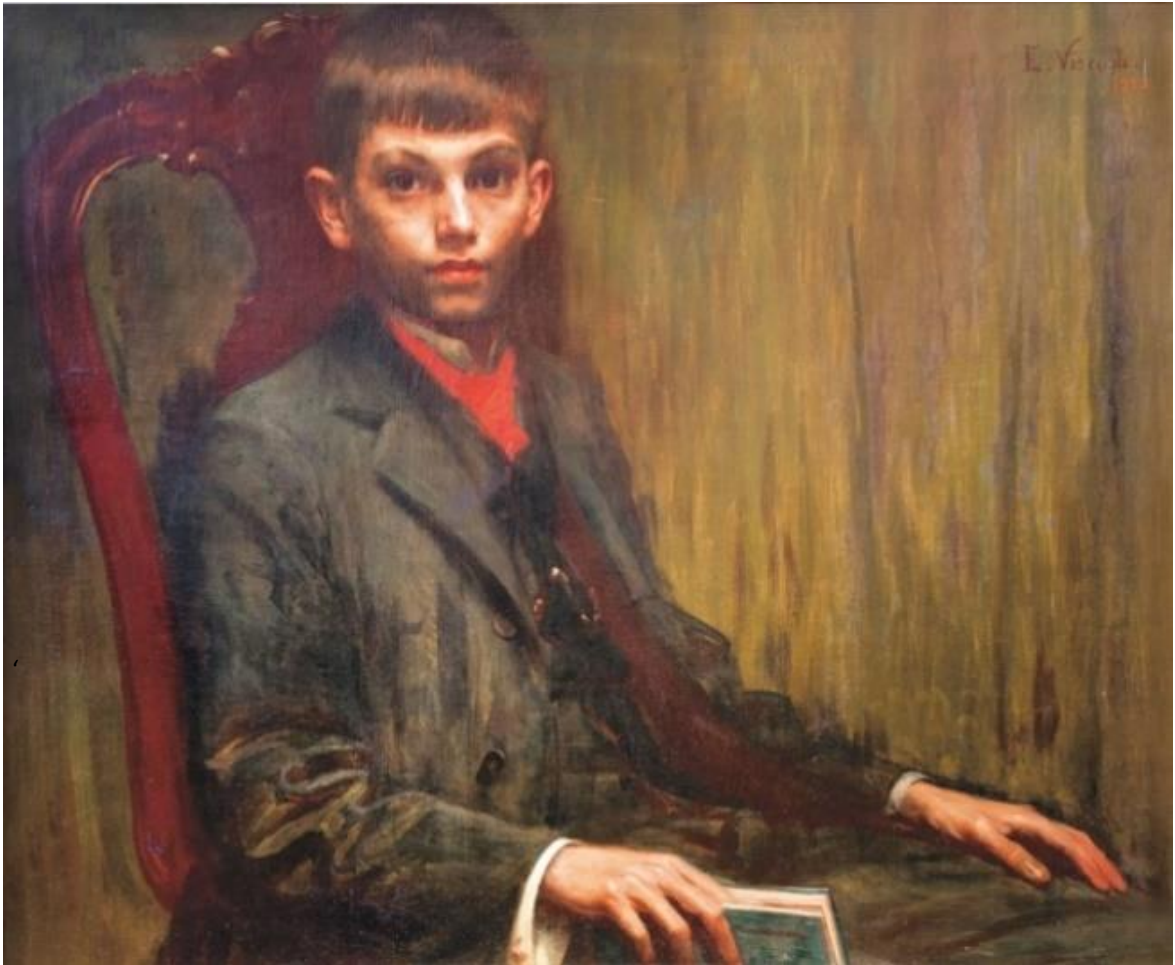
Imagem 18 – Visconti. Menino com livro 1912. Óleo sobre tela. Dimensões 126,5 x 95. Coleção Particular.