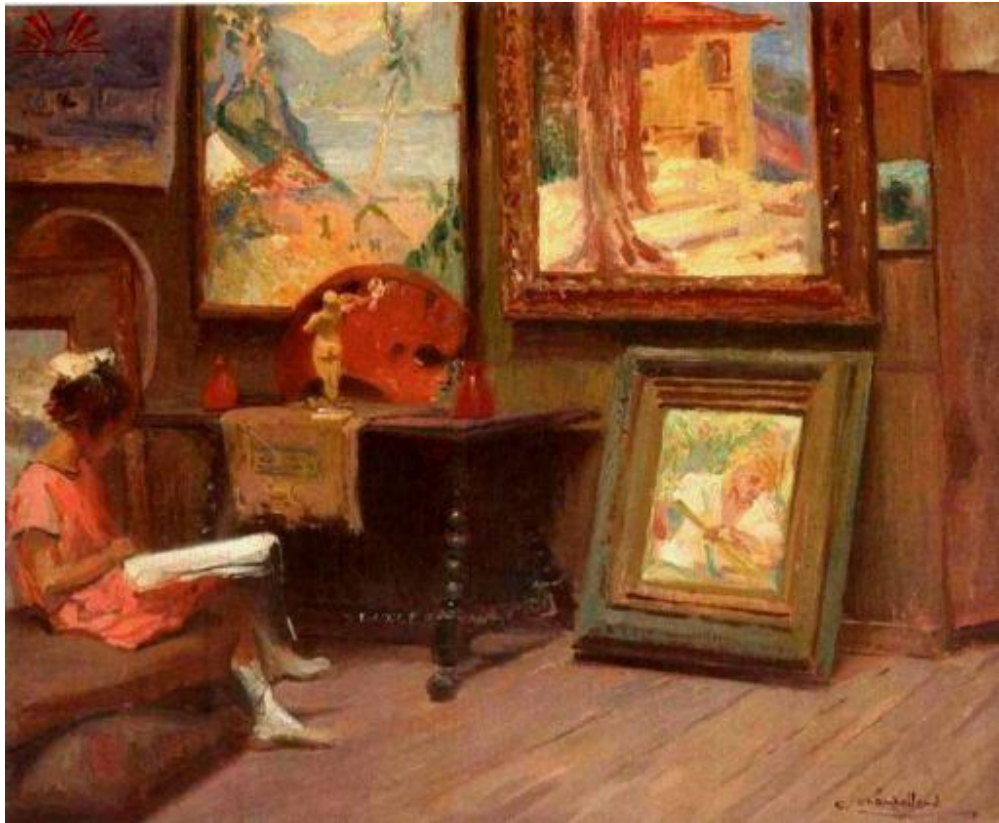
Chambelland. Leitura no Ateliê 1935. Óleo sobre tela. Dimensões: 46 x 54 cm. Coleção Particular.