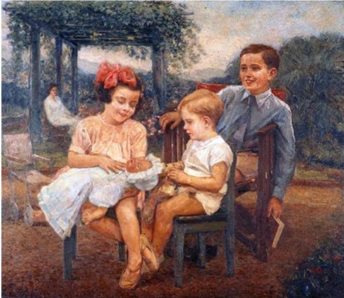
Imagem 15 - Rocco. Crianças s/d. Óleo sobre tela. Dimensões: 110x124 cm. Acervo Pinacoteca de São Paulo.