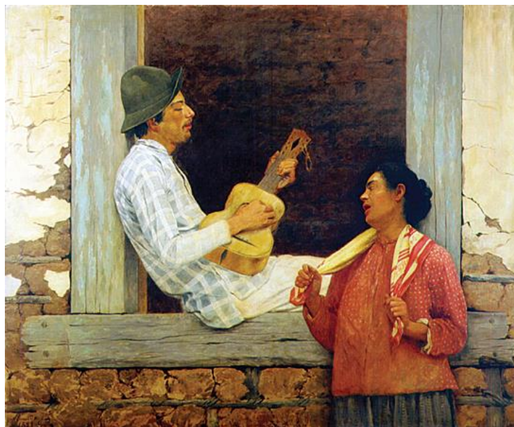
Figura 29: Almeida Junior. O violeiro 1899. Óleo sobre tela. Dimensão: 141 x 172 cm. Acervo: Pinacoteca do Estado de São Paulo

nome a introduzir o homem do povo em situações do seu cotidiano, no cenário artístico do país.