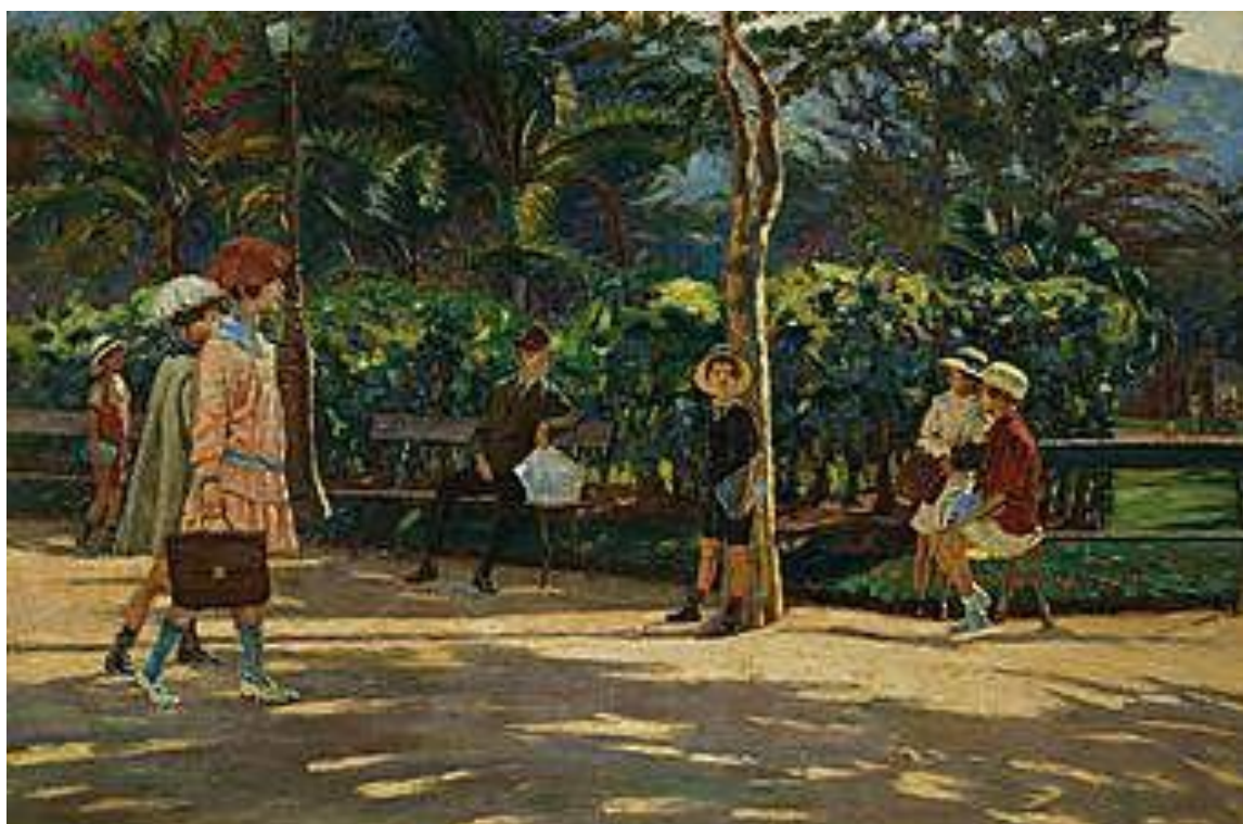
Imagem 12 – Manna. Praça Afonso Pena 1937. Óleo sobre tela. Dimensões: 98 x 148 cm. Coleção Particular.