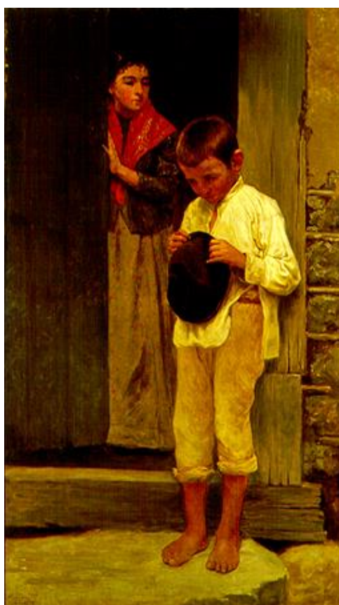
Figura 30: Almeida Junior. Recado Difícil 1895. Óleo sobre tela. Dimensão: 139 x 79 cm Acervo: Museu Nacional de Belas Artes