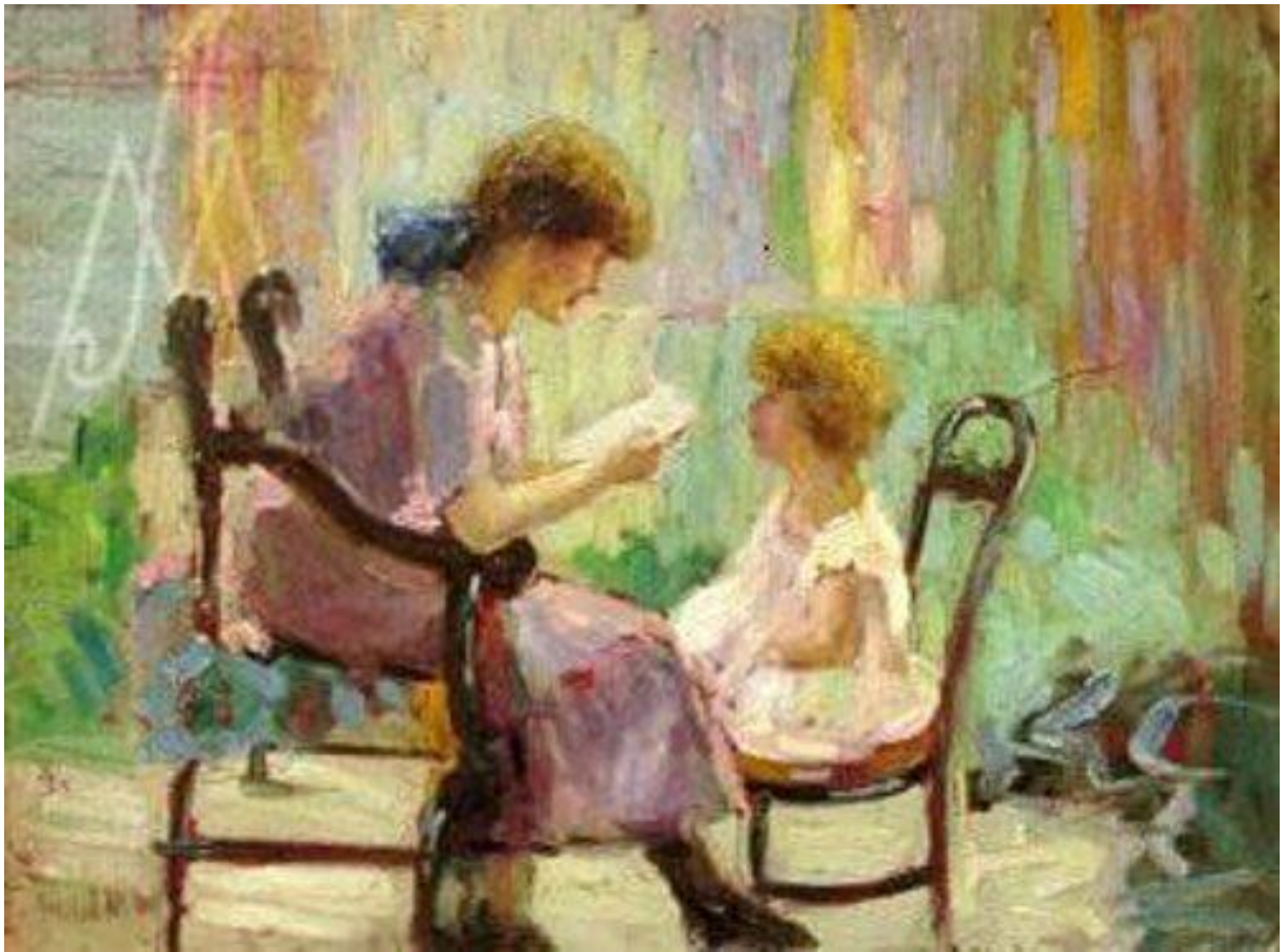
Imagem 7 – Albuquerque. Momentos de leitura s/d. Óleo sobre cartão. Dimensões 24x12cm. Acervo particular