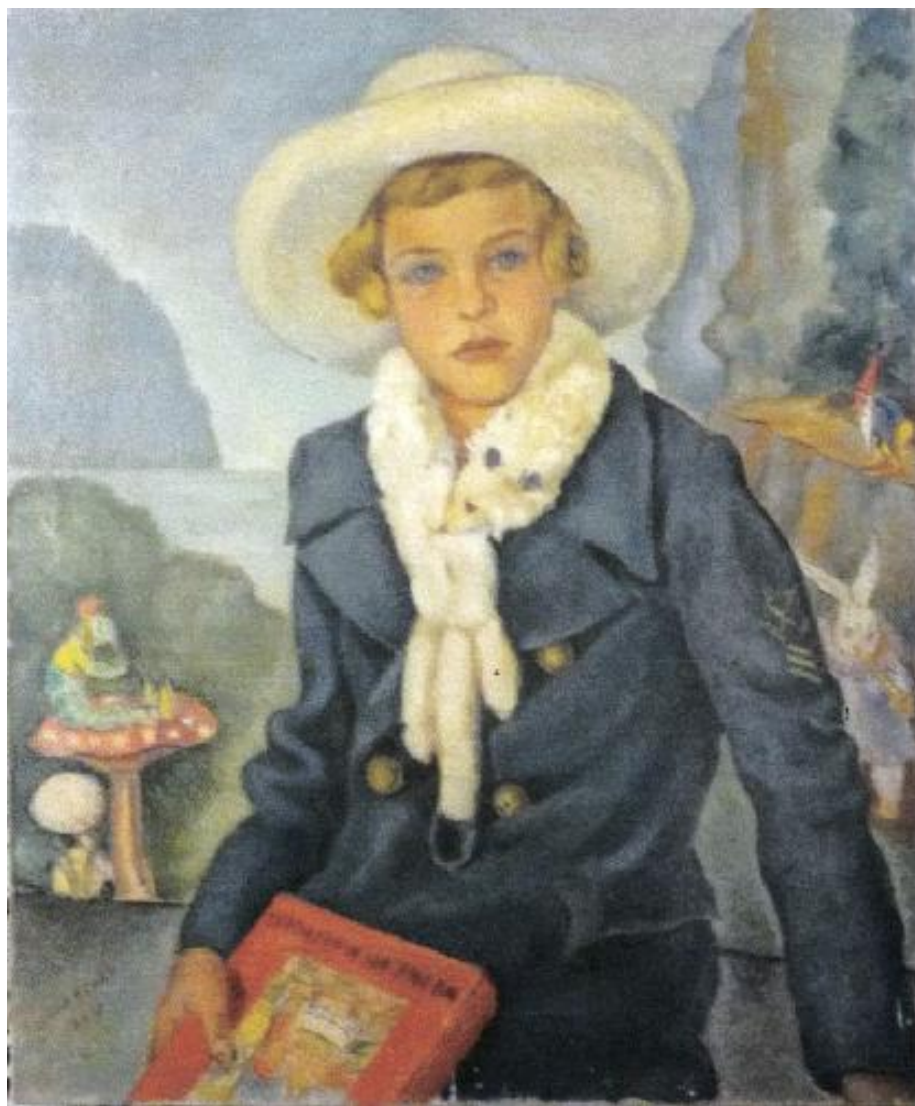
Neves. No país das maravilhas 1934 Óleo sobre tela. Dimensões 64,7 x 55,2. Pinacoteca de São Paulo