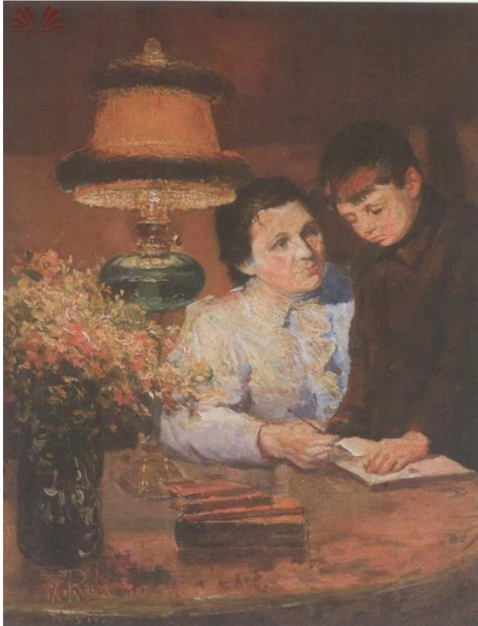
Imagem 16 - Rocha. Sagrada Missão 1900. Óleo sobre tela. Dimensões: 35 x 25 com. Coleção Particular