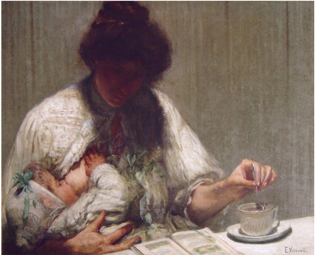
Imagem 19 – Visconti. Maternidade s/d. Óleo sobre tela Dimensões: 60 x 91 cm. Coleção Particular