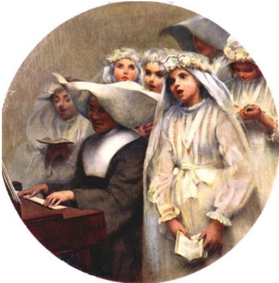
Imagem 20 – Visconti. As comungantes 1895. Óleo sobre tela. Dimensões 40 x 32. Coleção Particular