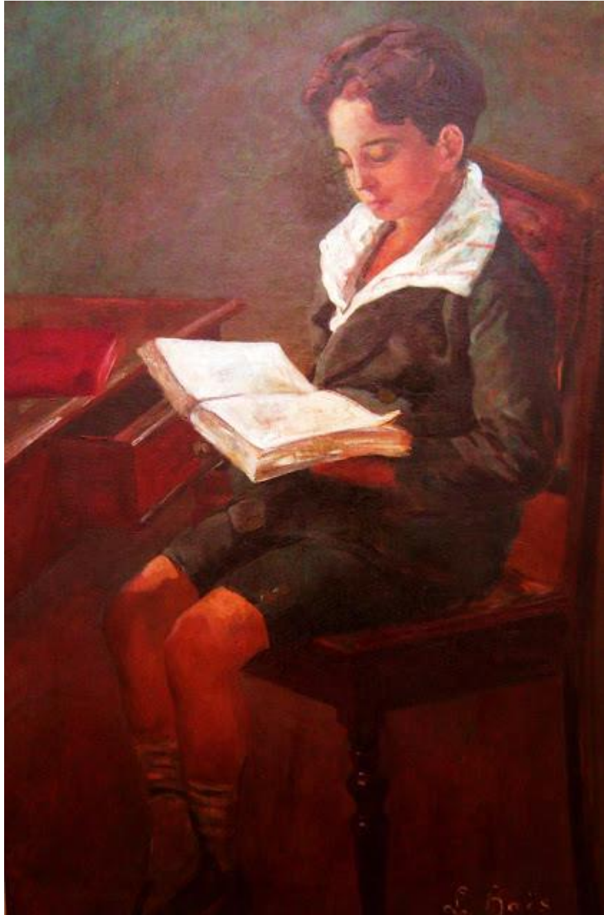
Imagem 8 - Baís. Menino com livro s/d. Óleo sobre tela. Coleção Particular.