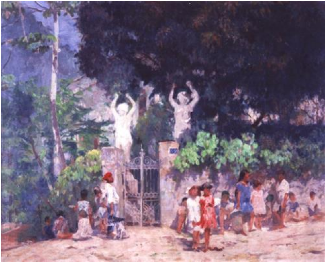
Imagem 27 – Visconti. A caminho da escola 1928. Óleo sobre tela. Dimensões 65 x 80. Acervo: Museu de Belas Artes do Rio de Janeiro