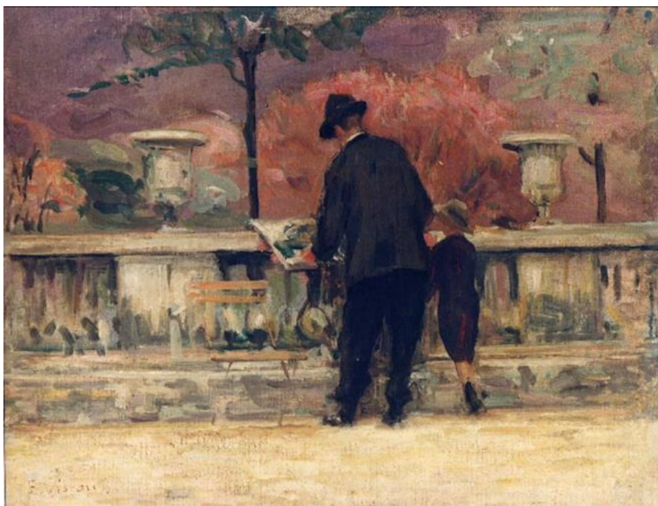
Imagem 22 - Visconti. Jardim de Luxemburgo 1905. Dimensões: 33,0 x 41,5cm. Coleção Particular.