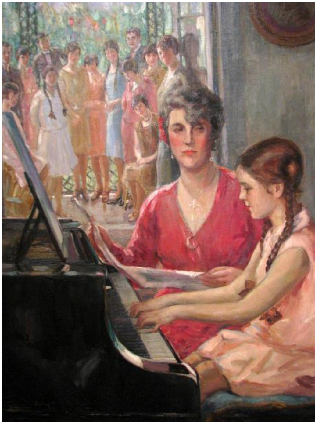
Imagem 6 - Albuquerque. Lição de Piano 1928. Óleo sobre tela. Dimensões: 120 x 100 cm. Acervo: Pinacoteca de São Paulo.