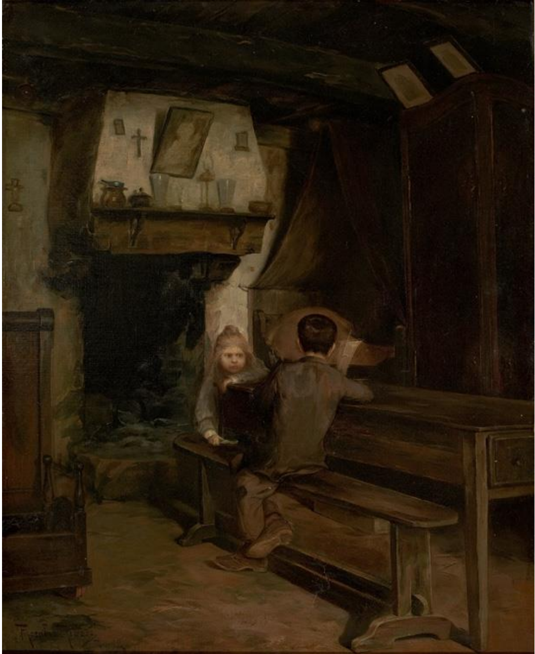
Imagem 14 - Ribeiro. Interior com duas crianças 1899. Óleo sobre tela. Dimensões: 60 x 50 cm. Acervo: Museu do Masp