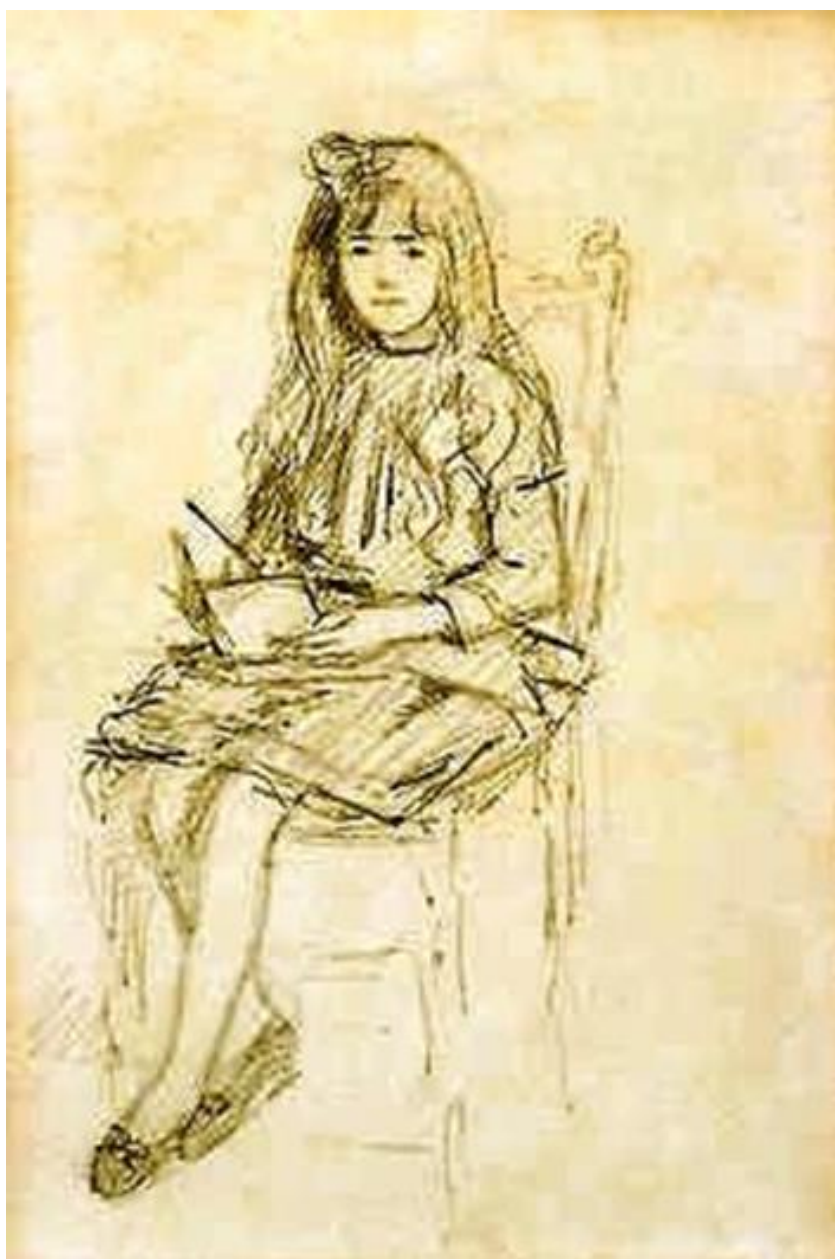
Imagem 31 – Worms. Estudo Menina com o livro 1890. Grafite sobre papel. Dimensões: 25 x 16 cm. Coleção Particular