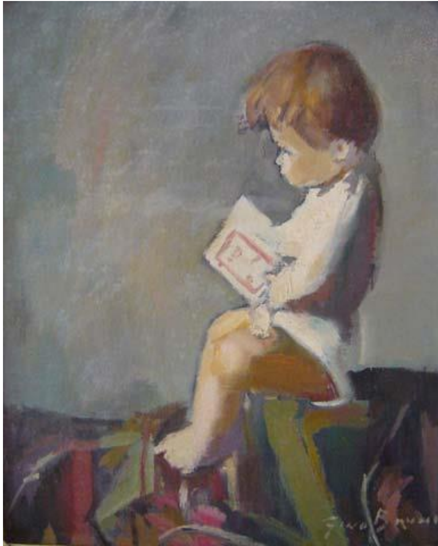
Bruno. Criança, s/d. Óleo sobre tela. Dimensões: 60x50 com. Coleção Particular