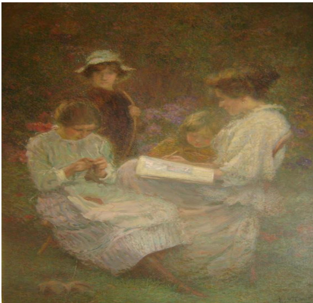
Imagem 25 – Visconti. A família do artista 1918. Óleo sobre tela. Dimensões 126,5 x 95. Coleção Particular.