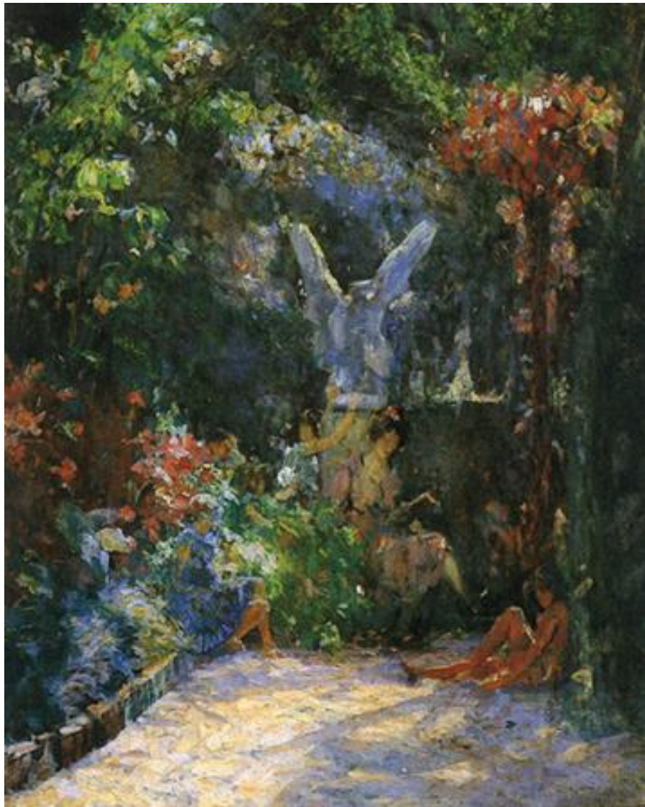
Imagem 28 – Visconti. Lição no meu jardim 1930. Óleo sobre tela. Dimensões: 81 x 65. Coleção Particular.