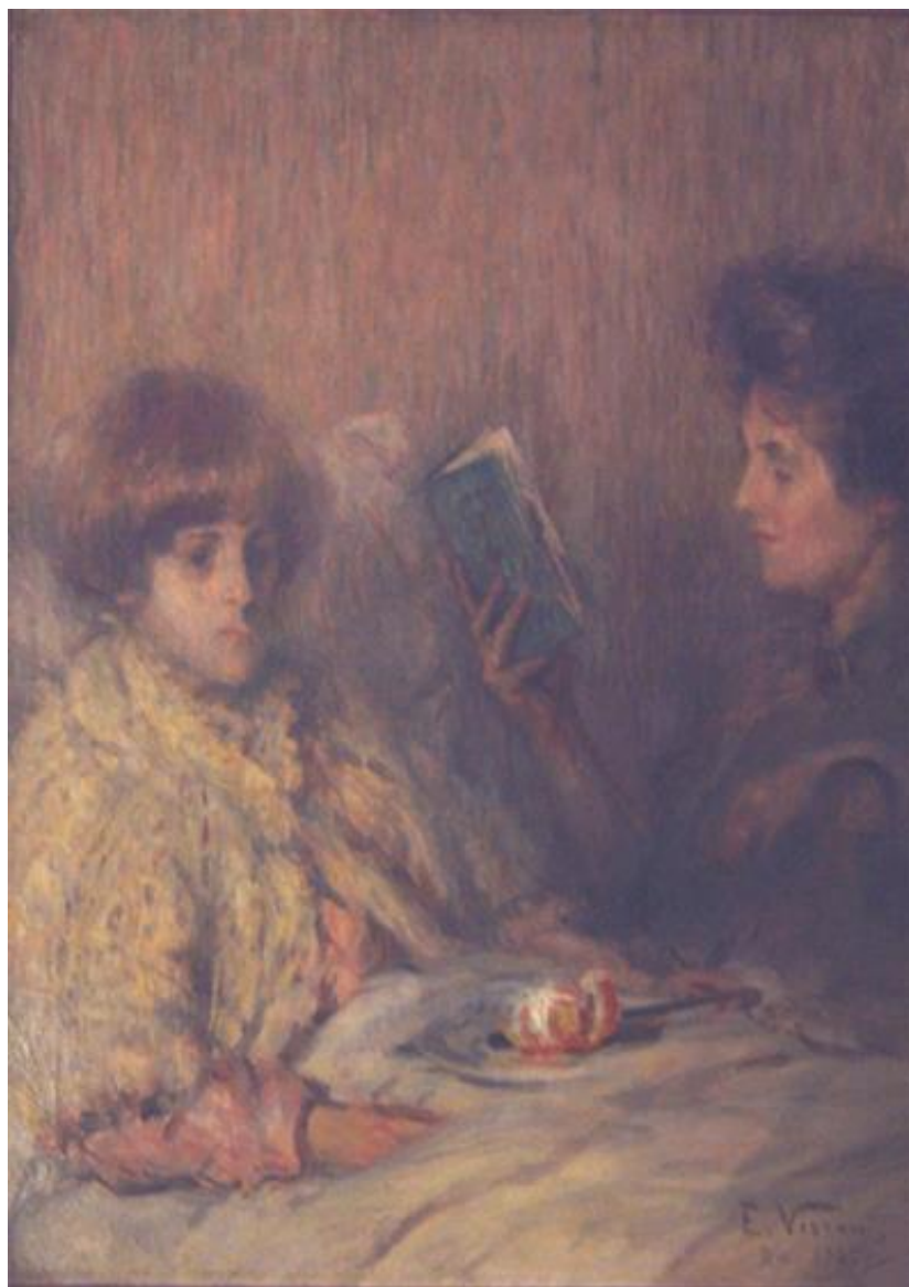
Imagem 26 – Visconti. O lar 1922. Óleo sobre tela. Dimensões 80 x 63 cm. Coleção Particular