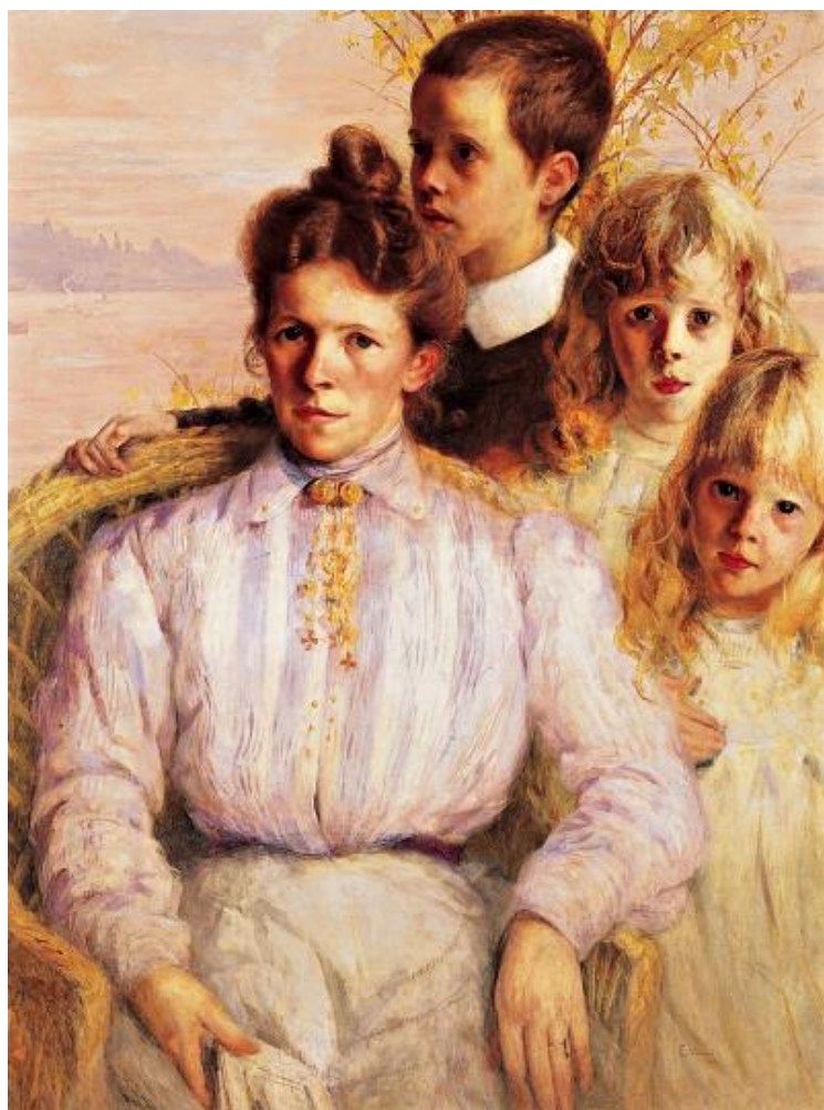
Imagem 21 – Visconti. A família do maestro Napomuceno 1902. Óleo sobre tela. Dimensões 93 x 72. Coleção Particular.