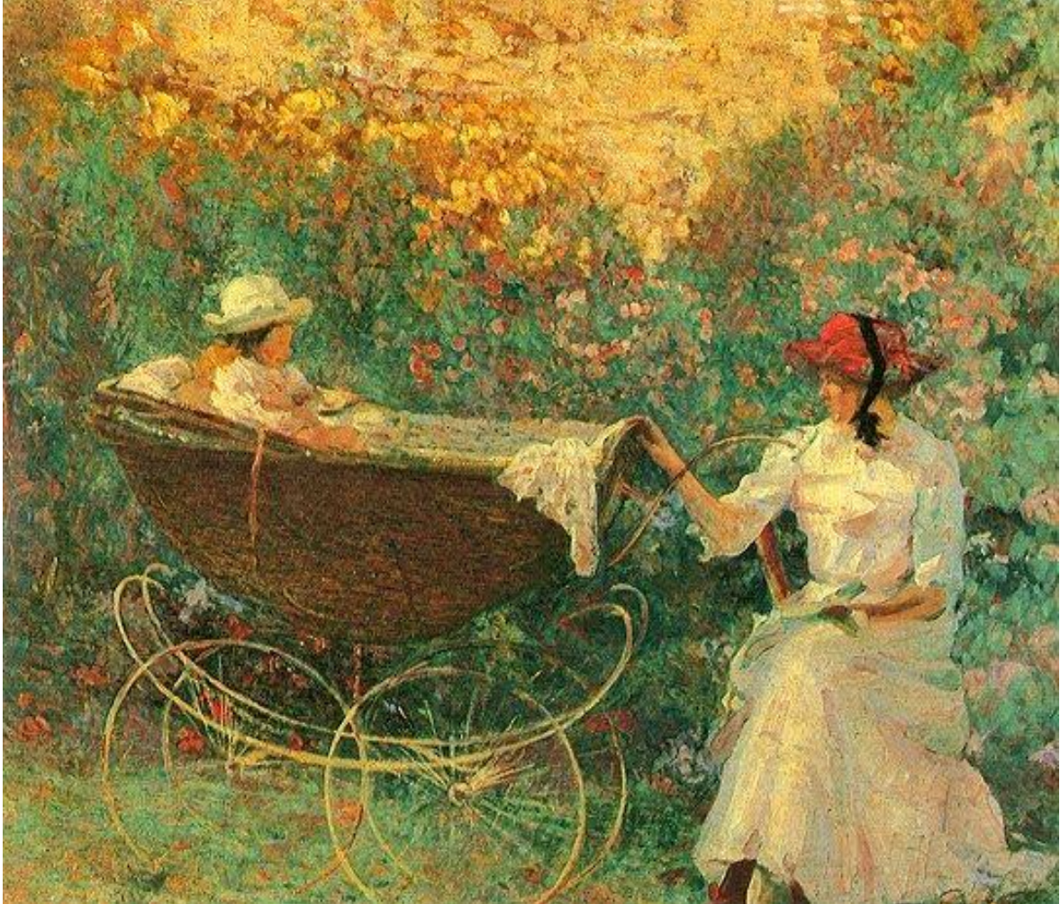
Visconti. Carrinho de criança 1917. Óleo sobre tela. Dimensões: 65 x 81 cm. Acervo Museu Castro