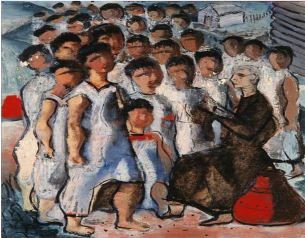
Imagem 13 – Portinari. Catequese 1940.