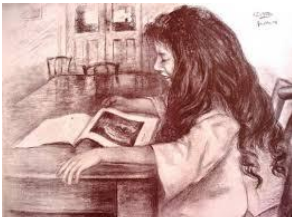
Imagem 17 - Sacramento. Menina que lê 1904. Desenho a carvão