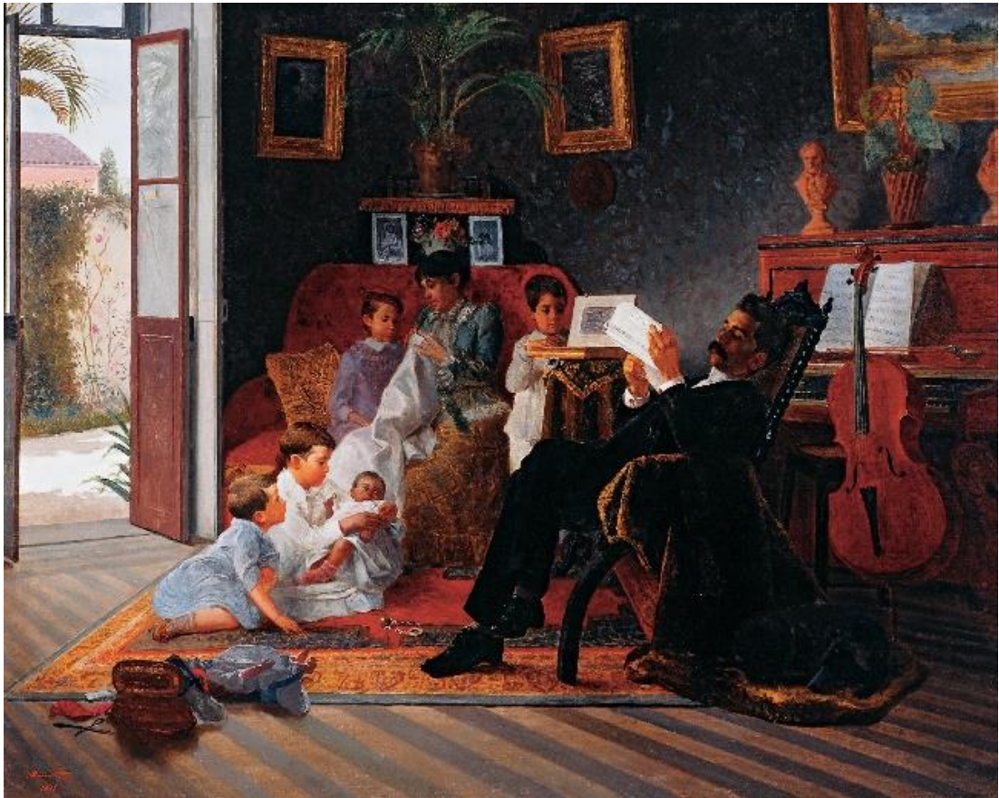
Imagem 10 - Almeida Júnior. Família de Adolfo Pinto: 1981. Óleo sobre tela. Dimensões 106 x 137 cm. Acervo: Pinacoteca de São Paulo.