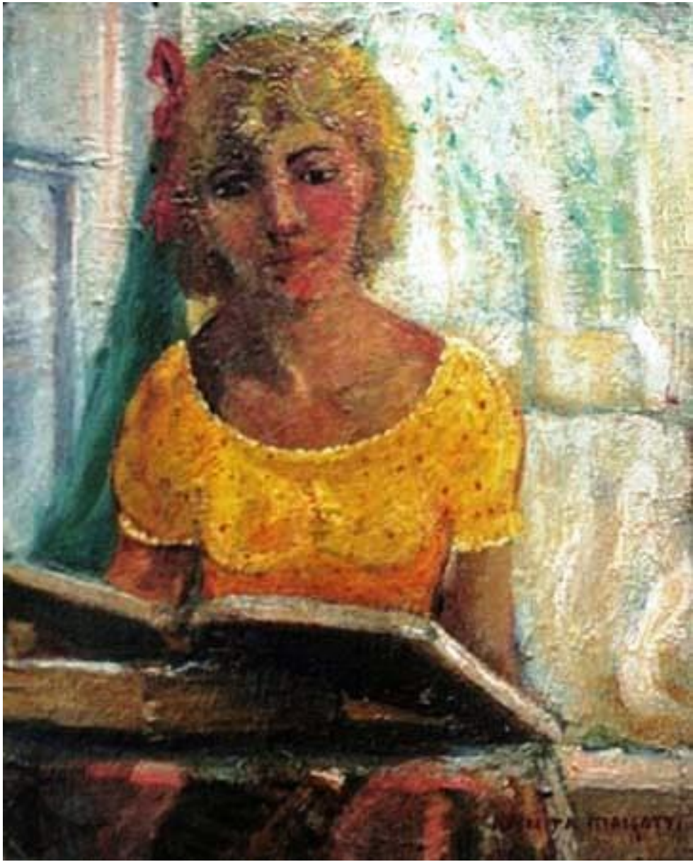
Imagem 11 – Malfatti. Menina lendo 1930. Óleo sobre cartão. Dimensões 33 x 22cm.