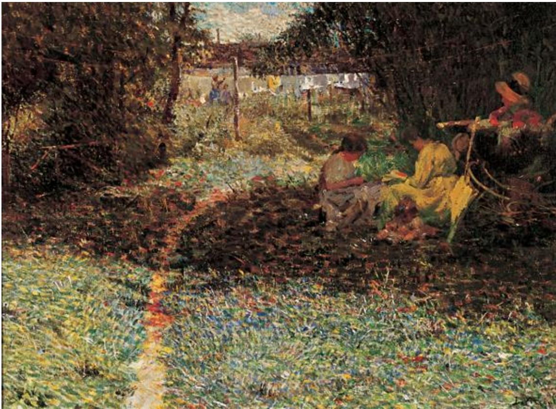
Imagem 24 – Visconti. Sob Folhagens 1913. Óleo sobre tela. Dimensões: 58 x 81 Coleção Particular.