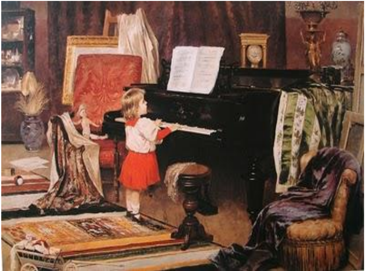
Imagem 9 – Figueiredo. Menina ao piano 1892. Óleo sobre tela. Dimensões 60 x 90 cm. Acervo: Coleção Fadel, Rio de Janeiro.