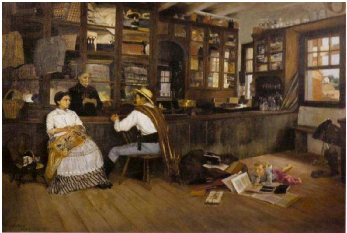
Imagem 30 - Weingartner. Fios emaranhados 1892. Óleo sobre tela. (s.d.) Óleo sobre tela. Dimensões: 75 x 100. Coleção Fadel