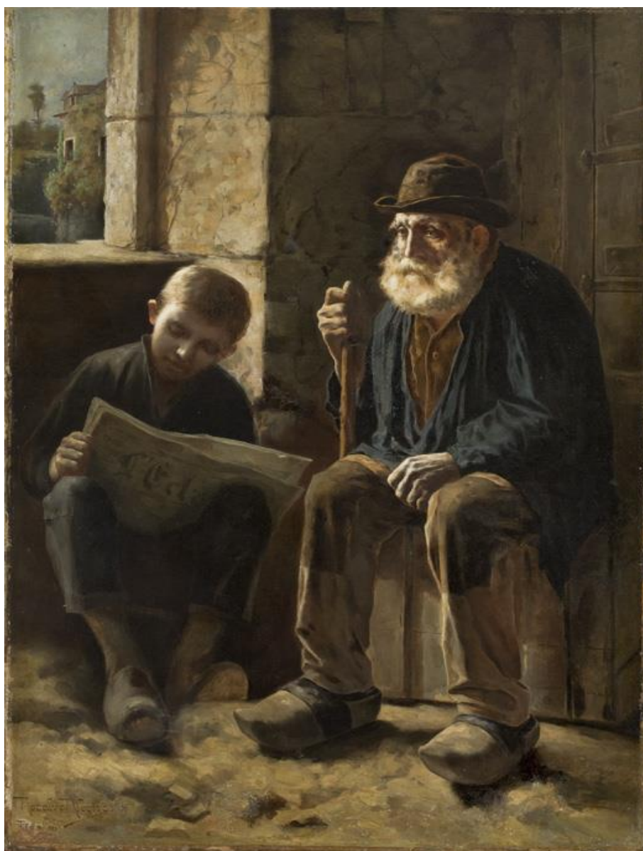
Ribeiro. Notícias desagradáveis 1896. Óleo sobre tela. Dimensões: 130 x 100. Acervo Museu de Arte de São Paulo.