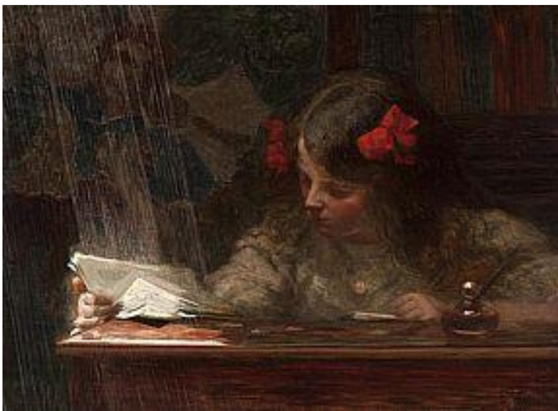
Imagem 23 – Visconti. Deveres 1910. Óleo sobre tela. Óleo sobre tela Dimensões: 60 x 80 cm. Coleção Particular.