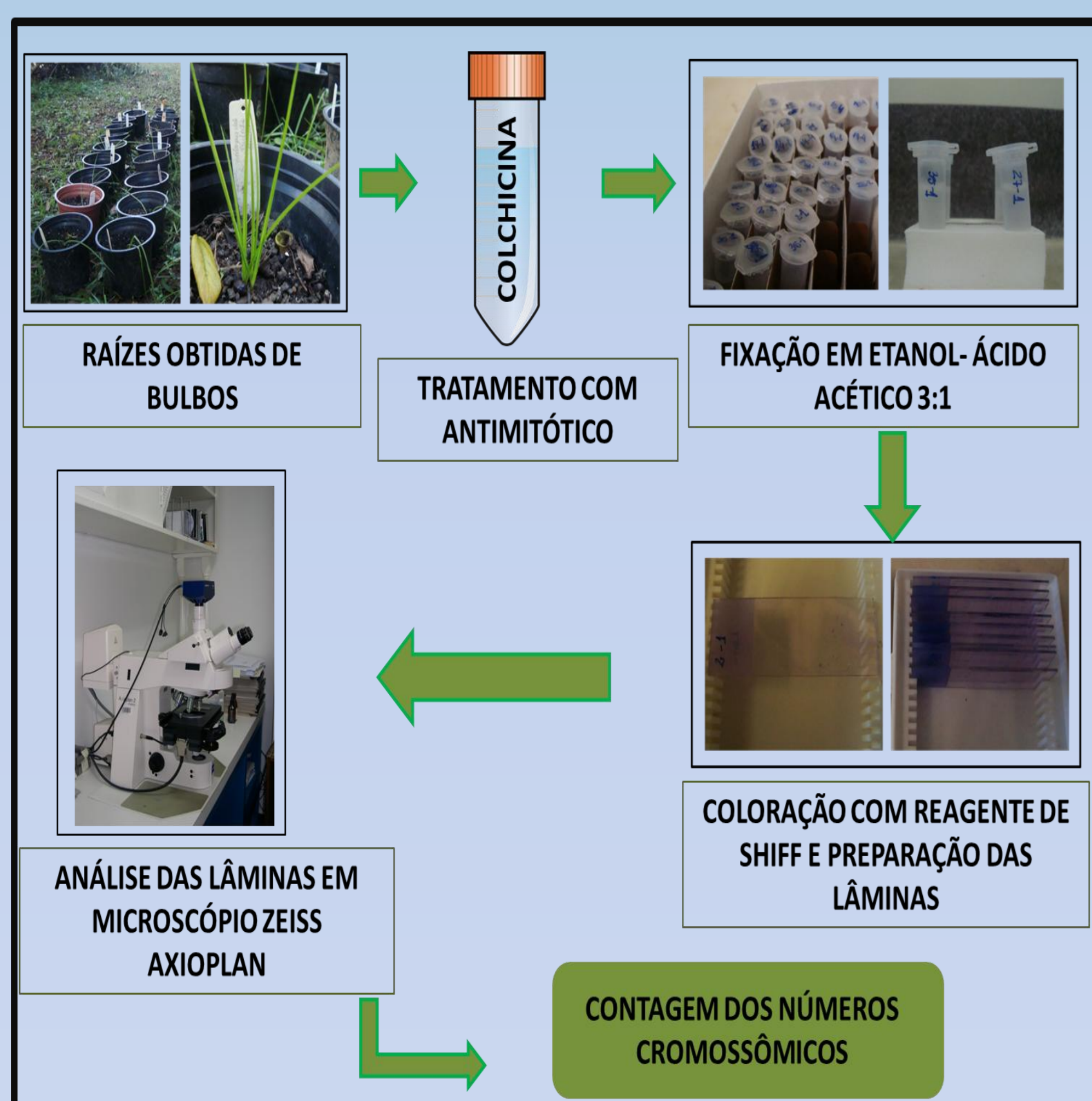
Figura 1 . Esquema da metodologia utilizada.