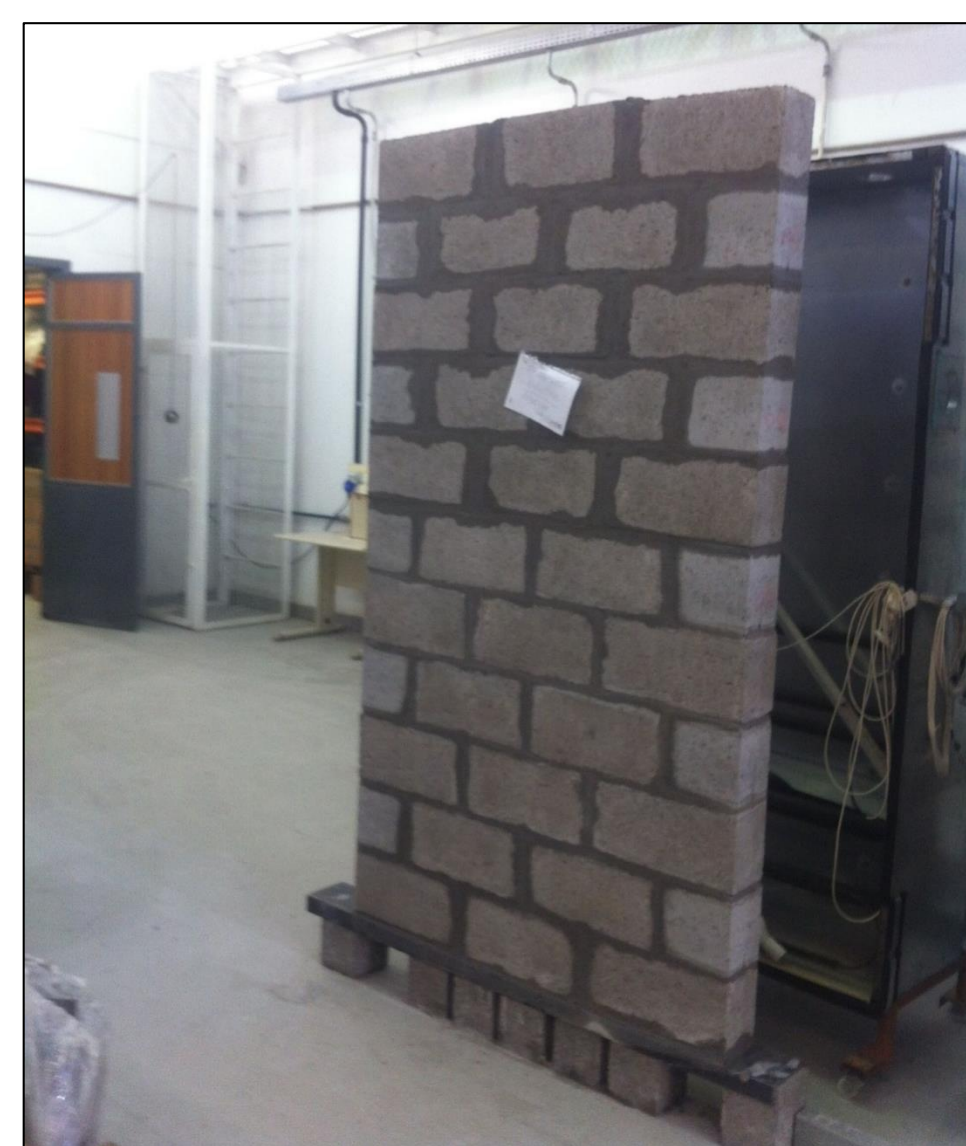
Corpo de prova sem restrição.