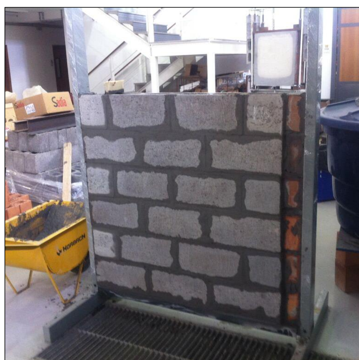
Corpo de prova com restrição em construção.

As confecção das paredes foram feita com blocos de concreto estrutural 14x19x39cm (largura x altura x comprimento), argamassa de assentamento (composta por cimento Portland, areia quartzosa, cal hidratado e aditivos) e argamassa estabilizada.