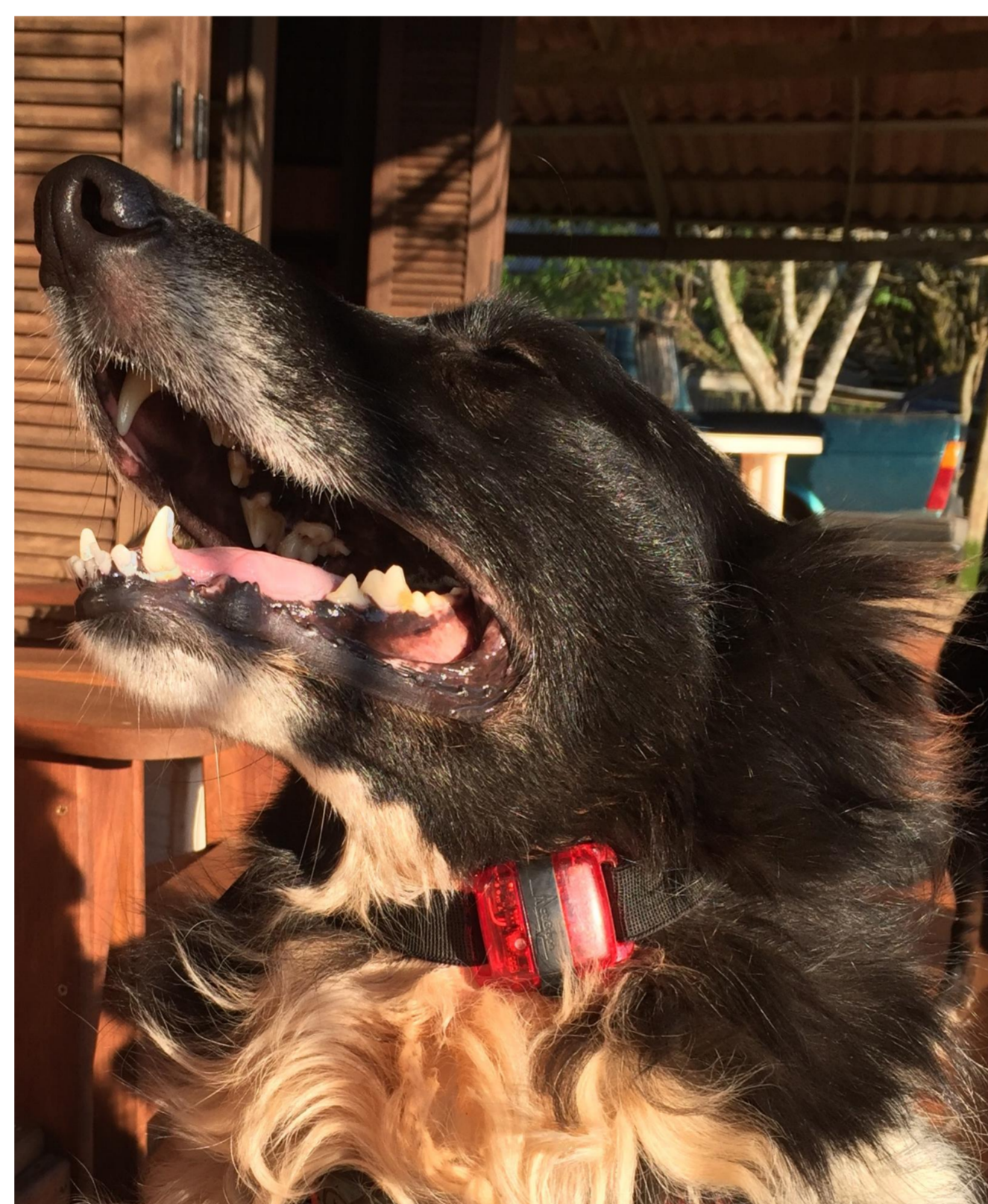
Figura 2 - Acelerômetro posicionado ventralmente no pescoço do cão com uma coleira elástica.