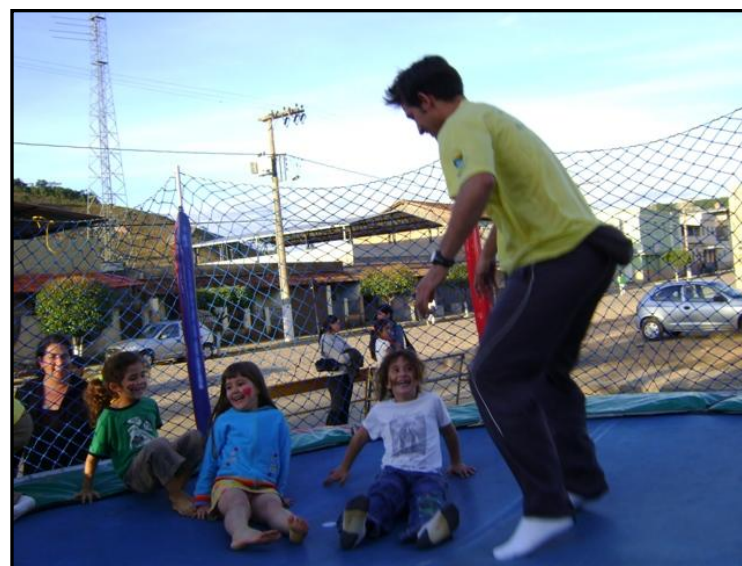
Furdução em Cipotânea