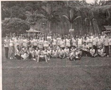
Agentes do PELC de diversos municípios participaram da capacitação na cidade de Guanhães.