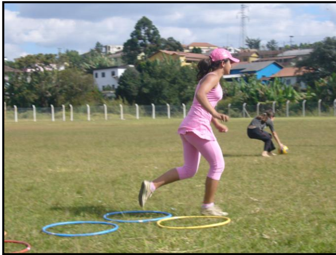
Qualificação em Guanhões