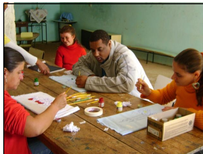
Oficinas na APAE em Brás Pires