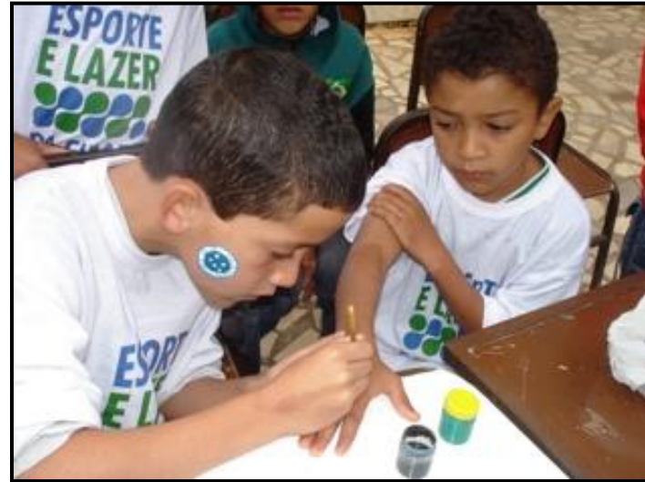
Furdução em Ressaquinha