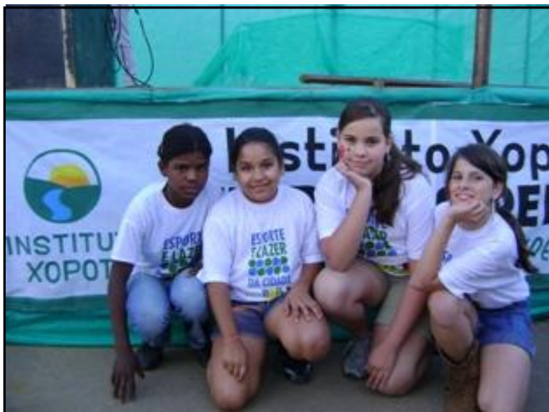
Furdução em Divinésia