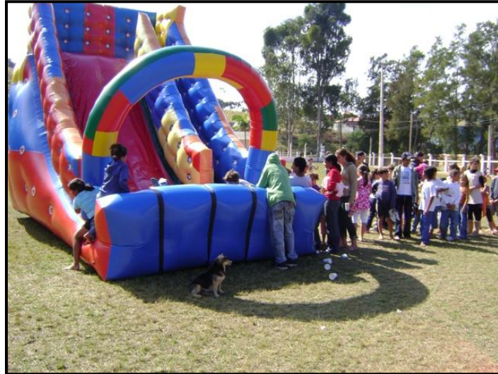
Furdução em Senhora dos Remédios