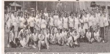
Equipe de Agentes Comunitários no treinamento em Guanhães.