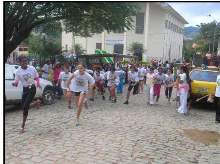
Mini-maratona em Brás Pires