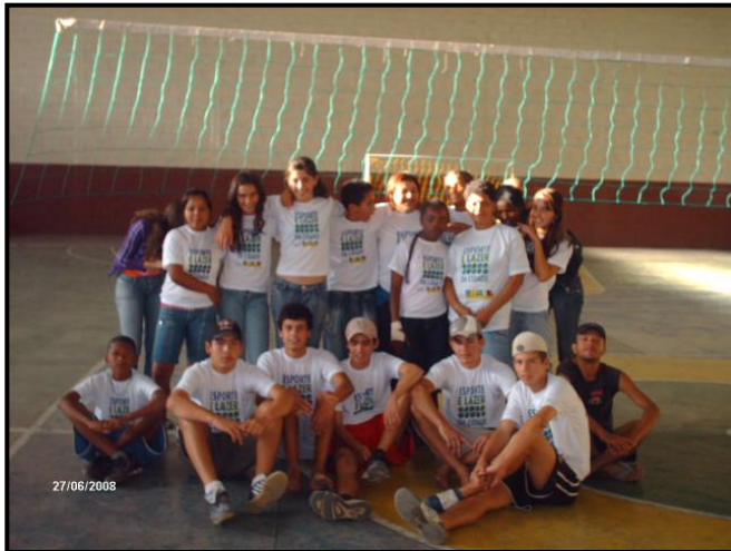
Furdunço em Divinésia