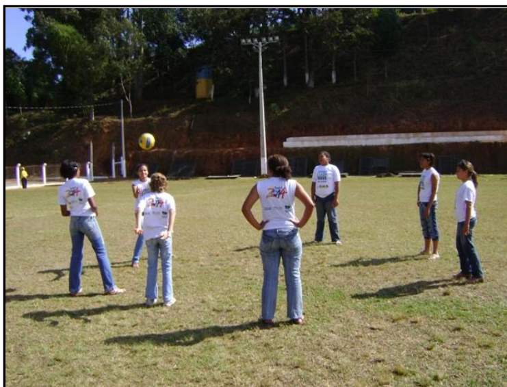
Oficinas em Capela Nova