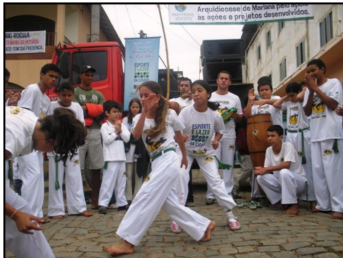
Oficina de Capoeira em Brás Pires