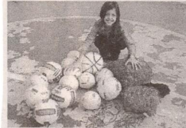
Criança recebe material do PELC.

O Instituto Xopotó para o Desenvolvimento Social, Econômico e Ambiental é uma organização da sociedade civil de interesse público - OSCIP, que nasceu em Brás Pires em 1999. Seu objetivo é a alavancagem social, econômica e ambiental da microrregião da zona da mata mineira, tendo Brás Pires como centro. Na área de atuação do Instituto estão as nascentes dos rios Xopotó e Piranga, primeiros formadores do rio Doce. Essa microrregião, chamada de Nascentes do rio Doce se caracteriza por um grande vazão econômico e social. Dessa forma, o Instituto Xopotó vem executando projetos na microrregião, com o intuito de suprir essa carência.