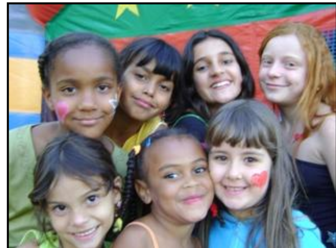
Oficinas em Alfredo Vasconcelos