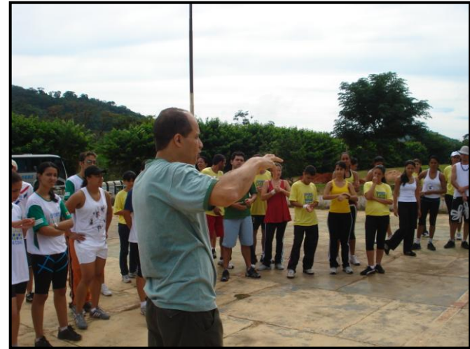
Oficinas em Carandaí