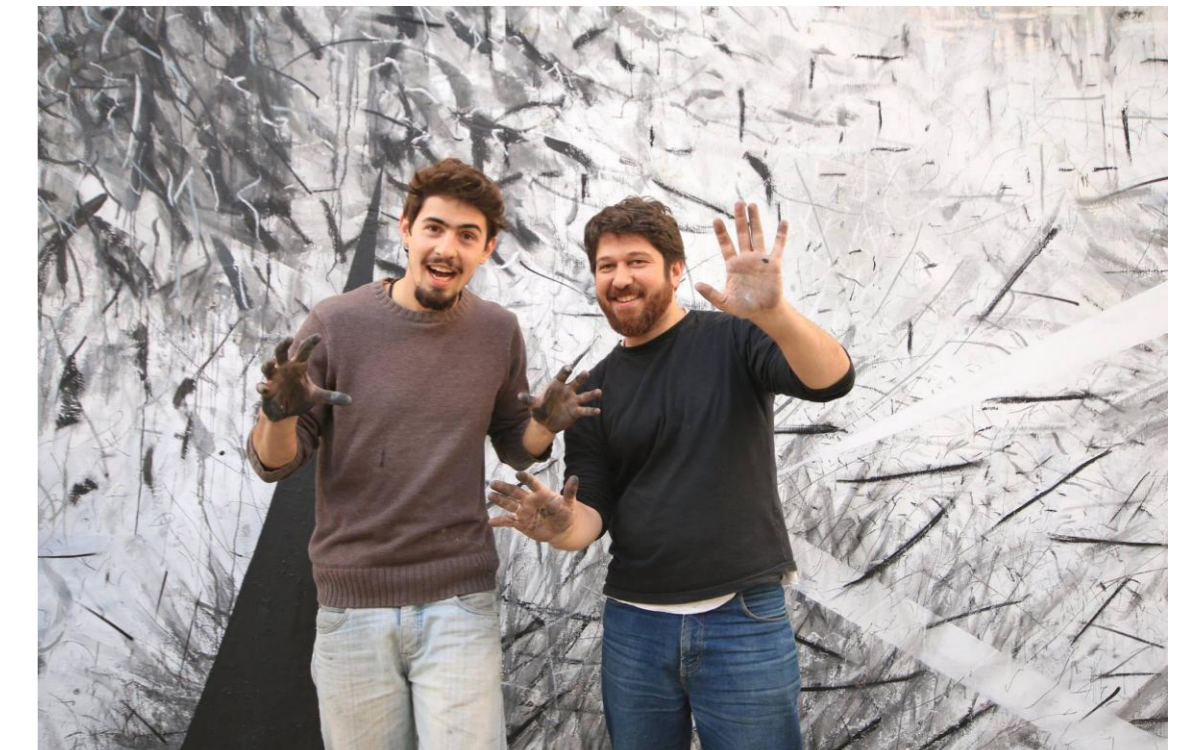
Exposição: LUGARES DO DESENHO Atelier D43 e convidados