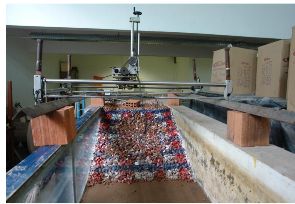
Figura 4: Mesa de coordenadas sobre o canal.