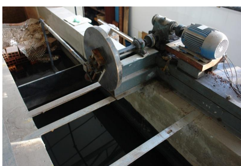
Figura 2: Gerador de ondas.

O gerador de ondas que o canal possui é do tipo articulado no fundo, constituído de uma pá plana movimentada por um baço regulável que gira em torno de um eixo, acionado por um inversor de frequência (figuras 2 e 3). A montante do gerador, há uma área de amortecimento preenchida de material poroso de modo a absorver as ondas geradas no sentido contrário.