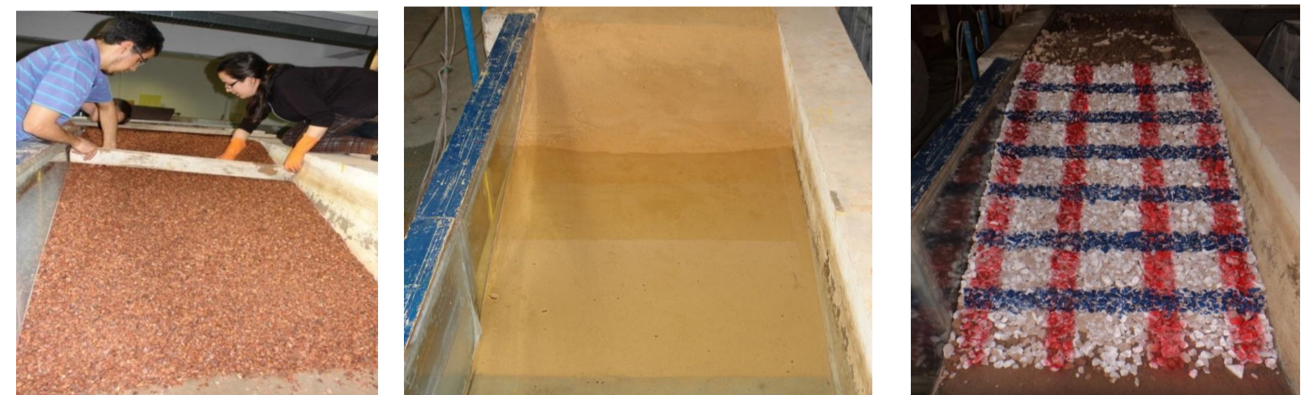
Figuras 6, 7 e 8: Taludes de brita média, areia e brita grande, respectivamente.

Os ensaios sempre iniciaram pelo processo de calibração das sondas. Em todos eles foram adquiridos registros por 180 segundos. O critério de dimensionamento para o diâmetro e inclinação do material do proteção do talude, utilizado nessa pesquisa, indicou o emprego, em grandezas do modelo físico do canal de ondas, do diâmetro D50 equivalente a 28 mm (142 mm no protótipo) com inclinação de 1:3. Com base nessa informação e visando explorar maiores possibilidades, os materiais empregados para a construção dos taludes foram denominados brita G (brita grande), brita P (brita média) e areia, com diâmetros correspondentes ao D50 iguais a 21, 5,4 e 0,32mm, respectivamente. Para cada um destes materiais, foram construídos taludes em três inclinações: 1:3, 1:2 e 1:1 (tabela 1). As ondas características identificadas no estudo do modelo com vertedouro em degraus para as vazões de 40, 60 e 80l/s foram denominadas a, b e c (tabela 2), respectivamente.