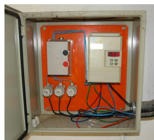
Figura 3: Variador de frequência.