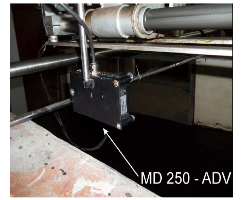
Figura 5: Laser MD250.

Os ensaios sempre iniciaram pelo processo de calibração das sondas. Em todos eles foram adquiridos registros por 180 segundos. O critério de dimensionamento para o diâmetro e inclinação do material do proteção do talude, utilizado nessa pesquisa, indicou o emprego, em grandezas do modelo físico do canal de ondas, do diâmetro D50 equivalente a 28 mm (142 mm no protótipo) com inclinação de 1:3. Com base nessa informação e visando explorar maiores possibilidades, os materiais empregados para a construção dos taludes foram denominados brita G (brita grande), brita P (brita média) e areia, com diâmetros correspondentes ao D50 iguais a 21, 5,4 e 0,32mm, respectivamente. Para cada um destes materiais, foram construídos taludes em três inclinações: 1:3, 1:2 e 1:1 (tabela 1). As ondas características identificadas no estudo do modelo com vertedouro em degraus para as vazões de 40, 60 e 80l/s foram denominadas a, b e c (tabela 2), respectivamente.