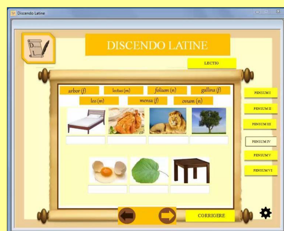
Figura 6: exercício 4