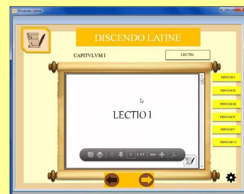
Figura 3: lição em PDF