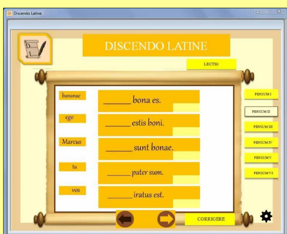
Figura 5: exercício 2