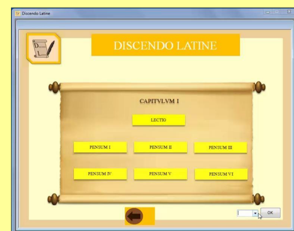
Figura 2: entradas para a lição ou para os exercícios