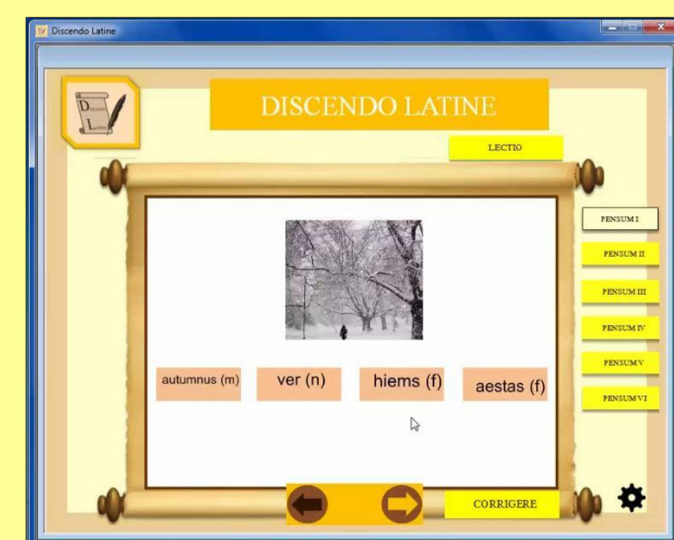
Figura 8: exercício 6