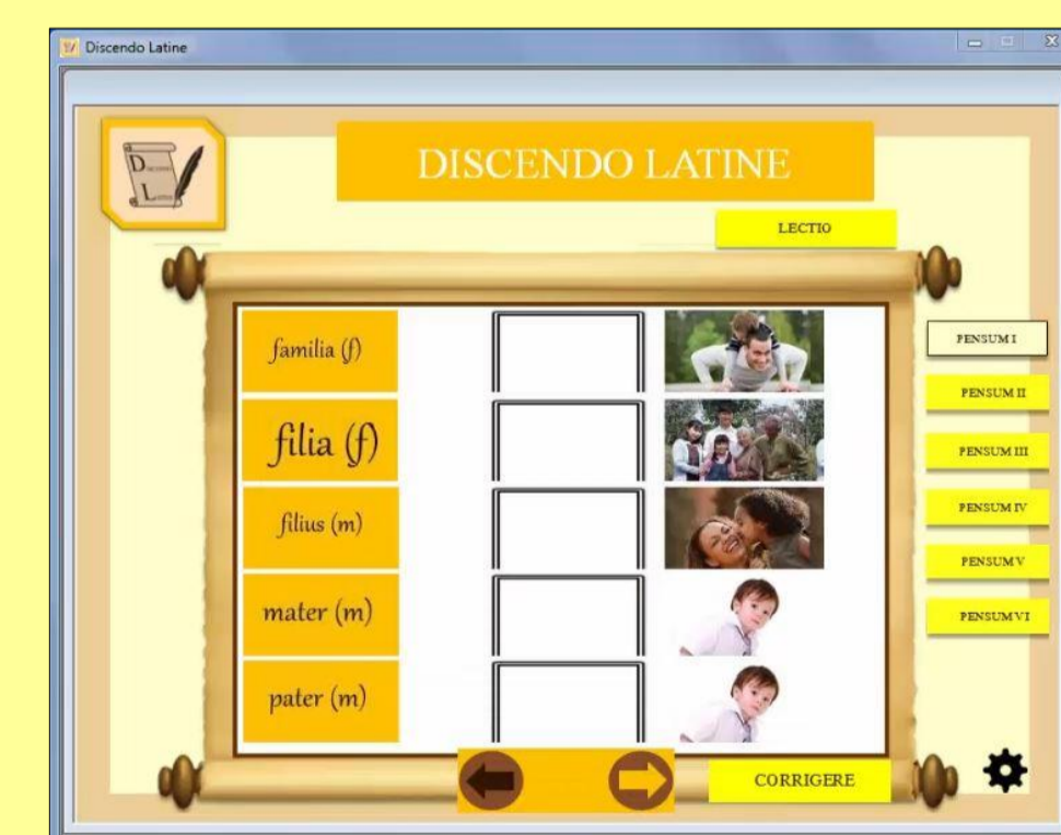
Figura 4: exercício 1