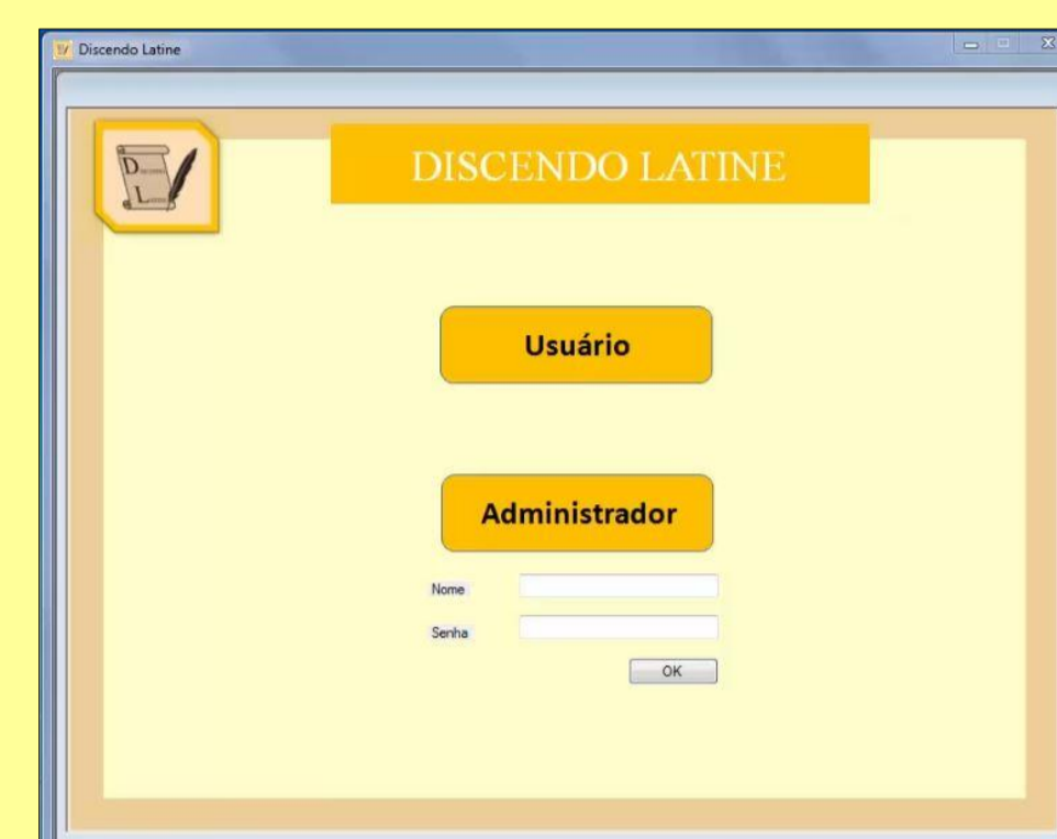
Figura 1: acesso do usuário e do administrador

Atualmente, estamos aperfeiçoando o Discendo Latine , através de testes, correções e aprimoramento do conteúdo, para que ele possa ser disponibilizado ao público interessado.