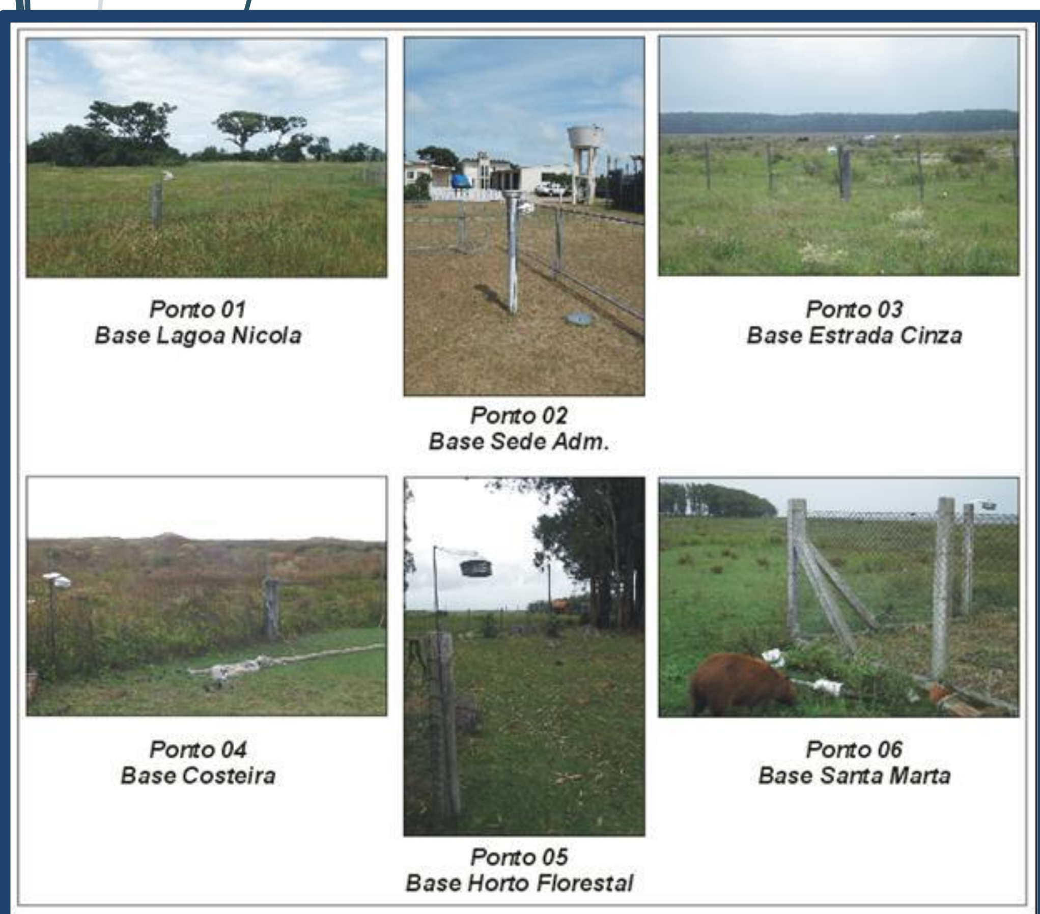
Figura 1 – Ambientes de instalação dos abrigos meteorológicos