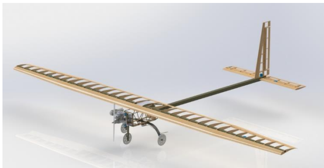
Figura 1: Aeronave Desenvolvida

De forma a cumprir com alguns dos requisitos do regulamento da competição, voltados predominante a utilização de eletrônica embarcada, foi desenvolvido um projeto aeronáutico visando a simplicidade, tendo em vista que este será utilizado como plataforma para testes dos sistemas eletrônicos a serem desenvolvidos.