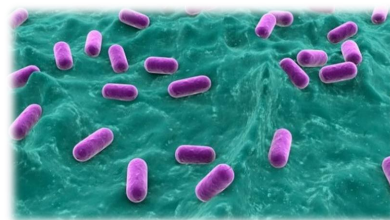
Figura 1: L. plantarum , uma bactéria láctica referida internacionalmente como um excelente probiótico.