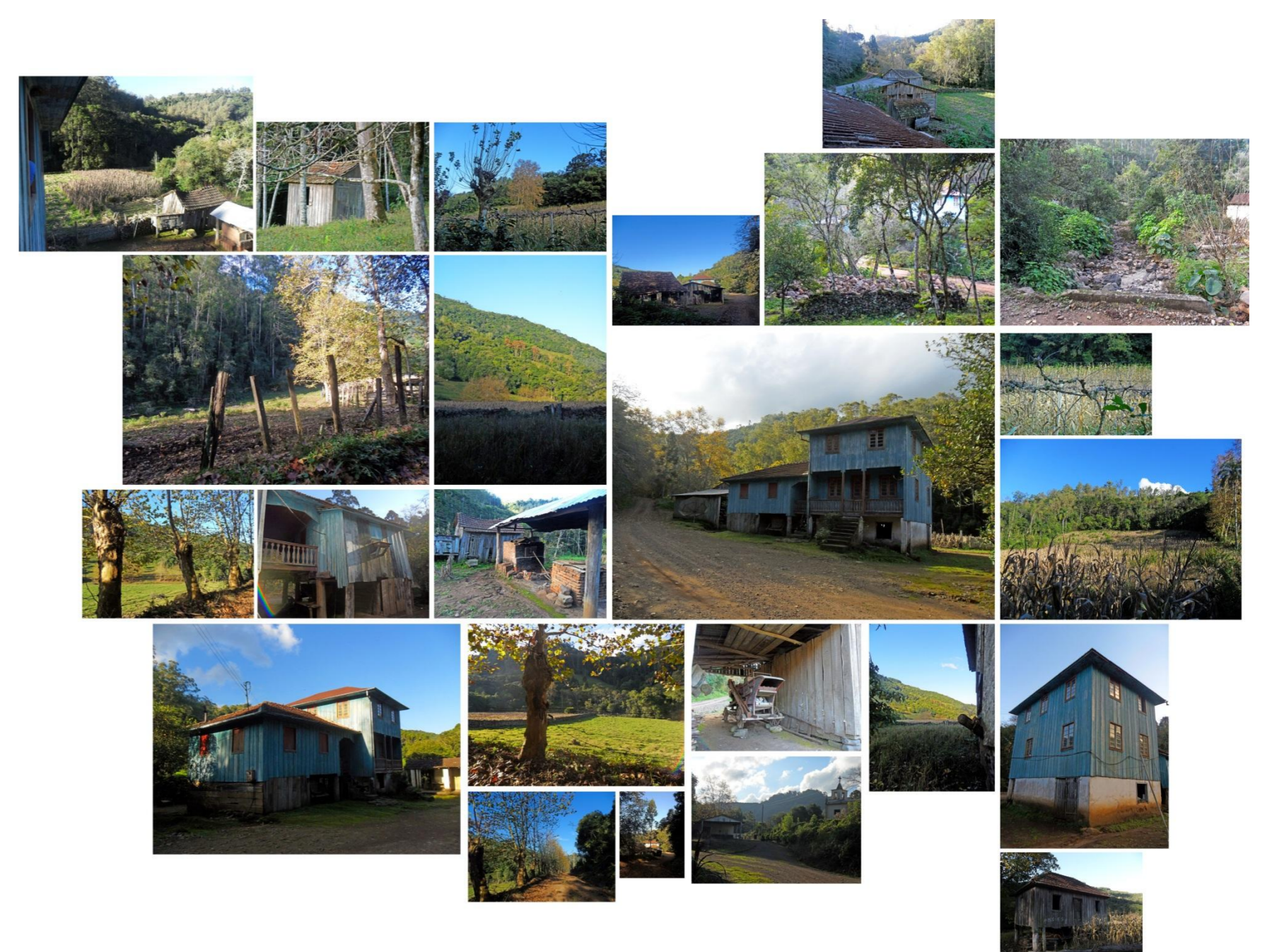
Imagens do Lote Rural Típico da Imigração Italiana