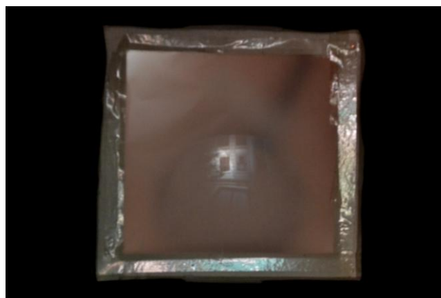
Figura 4. Registro de imagem da escola invertida no visor da câmera escura.

Finalizada a câmera, os alunos experimentaram visualizar pontos da sala de aula, principalmente locais de contraste de luz e sombra (figura 4). Alguns foram ao espaço externo da sala fazer observações.