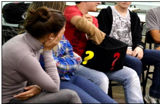
Figura 1. Aluno retirando um objeto da caixa.

As músicas “As coisas”, de Arnaldo Antunes, e “O que se perde enquanto os olhos piscam”, de Teatro Mágico, tocavam enquanto a caixa andava de mão em mão no círculo formado pelos alunos. Quando a música era pausada, o aluno que estivesse com a caixa deveria retirar um objeto e dar a ele um novo sentido através de fala ou gesto (figura 1). A instrução foi a de que o uso original deveria ser subvertido, transformado em outro, coerente ou não, mas que explorasse um olhar criativo e descondicionado sobre tal objeto. Muitas das elaborações de novos sentidos pelos alunos foram baseadas no formato dos objetos, com criações através de analogias, transformando-os em outro utilitário ou em brinquedos. As elaborações não se deram muito além da lógica, mas a participação foi satisfatória no sentido da colaboração e respeito de todos. O jogo teve duração de trinta minutos, pois a turma decidiu continuar até que todos tivessem sua vez de participar.