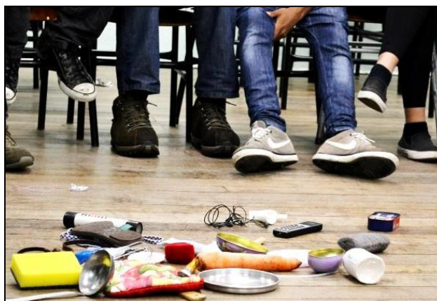
Figura 2. Os alunos sentaram-se em círculo e os objetos retirados da caixa foram depositados no meio da sala.

Na segunda parte da aula, ainda pensando em um olhar diferenciado para o cotidiano recorrente, os alunos assistiram ao filme “Life in a Day” 3 , uma referência importante ao tema do projeto, por mostrar diversos modos de ver e de ser, além de estimular a percepção e admiração das pequenas coisas presentes no cotidiano. No filme, alguns temas são abordados segundo a percepção de pessoas de vários países, - como Afeganistão, Estados Unidos, Índia, entre outros – proporcionando observar diferentes pontos de vista acerca de um mesmo tema. O filme, com legenda em português, pode ser assistido gratuitamente através do link: http://www.youtube.com/watch?v=GIw7dJg1L84 .