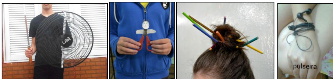
Figura 5. Fotografias produzidas pelos alunos.

Em um 3º momento, uma proposta foi lançada aos alunos como atividade para pensarem e realizarem em casa: cada um deveria escolher objetos pessoais presentes em seu cotidiano e criar novos sentidos para eles. A atividade foi semelhante à da Caixa Assustada, porém com objetos pessoais e em registro fotográfico. Alguns alunos realizaram performance se autorretratando nessas invenções, outros atribuíram novos nomes as coisas e, ainda, alguns utilizaram familiares como modelos fotográficos (figura 5). A maioria dos alunos concluiu a tarefa enviando as fotos para as bolsistas por e-mail. É interessante pensar se a escolha dos objetos estava atrelada a questão de identidade ou ocorreu ocasionalmente, mas o que ficou evidente foi uma aproximação com as coisas caseiras de cada um, o que gerou conversas sobre particularidades de suas vidas, gostos e escolhas. Essa atividade tinha como propósito estimular a percepção das pequenas coisas, buscando o extraordinário no ordinário, através da apreciação e ressignificação dos objetos comuns do nosso dia-a-dia.