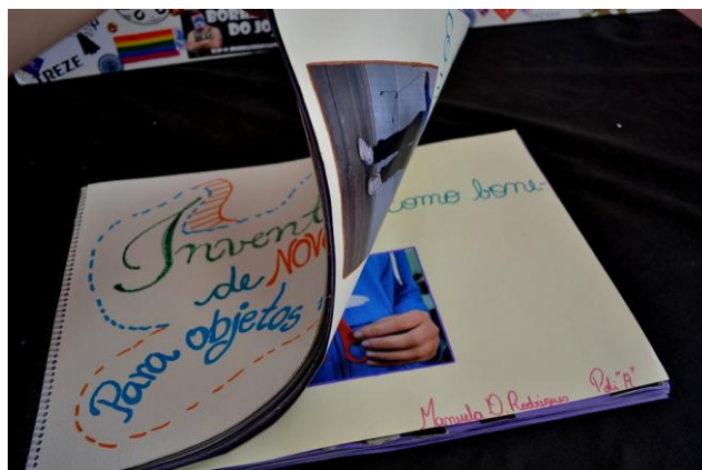
Figura 6. Livro encadernado com as páginas criadas pelos alunos.