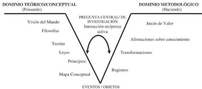
Gráfico 1. Diagrama V mostrando sus elementos interactivos involucrados en la construcción del conocimiento

Dentro del estilo instruccional de resolución de problemas, el enfoque epistemológico 2 constituye una herramienta útil a la luz de las tendencias actuales en la didáctica del laboratorio de ciencias; el mismo se basa en el uso del diagrama V de Gowin, el cual se ha recomendado desde hace varias décadas (Moreira y Levandowski, 1983; Novak, 1979; Novak y Gowin, 1988; Tamir, 1989). Algunos estudios en Venezuela han reportado su aplicación en el laboratorio (Blanco, 2001; Flores, 2004, 2007; Sanabria y Ramírez, 2004; Andrés, Meneses y Pesa, 2007). Una representación de la estructura básica del diagrama V (Gowin y Álvarez, 2005, p. 41; Novak y Gowin, 1988, p. 77) se muestra a continuación: