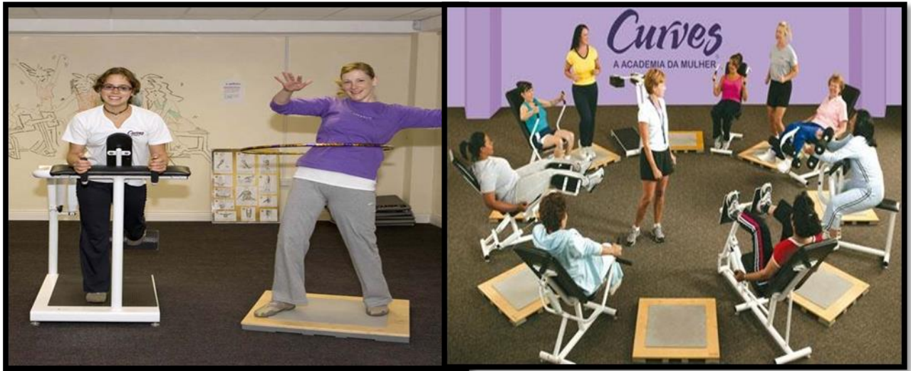
Ilustração 3 – Método de Treinamento em Circuitos